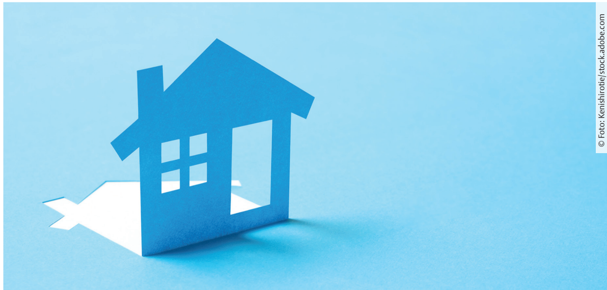
► Abb. 1 Durch das ambulante Management nach vorzeitigem Blasensprung am Termin, können sich Frauen länger in ihrem vertrauten häuslichen Umfeld aufhalten. (Symbolbild)

Das ambulante Management nach vorzeitigem Blasensprung am Termin erlaubt es, dass Frauen sich möglichst lang in ihrer vertrauten Umgebung aufhalten. Seit September 2017 wird das ambulante Procedere im St. Joseph Krankenhaus Berlin-Tempelhof erfolgreich praktiziert. Nun liegen die Ergebnisse einer retrospektiven, quantitativen Datenerhebung vor, die die positiven Effekte hinsichtlich des geburtshilflichen Outcomes bestätigen.