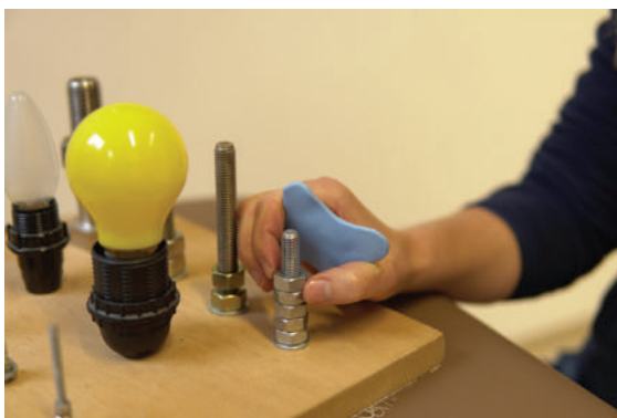
► Abb. 6 Bei der Übung mit dem Brunelli-Plättchen flektiert die Patientin gezielt das Daumenendgelenk und steuert so den M. flexor pollicis longus verstärkt an.

Beginn ohne, später mit Widerstand (z. B. Klammern). Im Anschluss an die Therapie und auch zu Hause können zur Automatisierung der Bewegungsabläufe Übungen ohne Brunelli-Plättchen und Widerstand im warmen Rapsbad erfolgen.