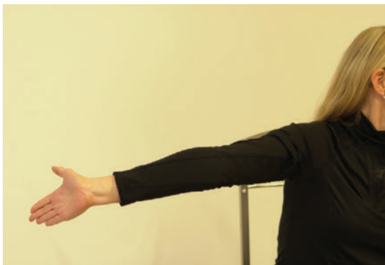
► Abb. 5 Der Tensioner in Eigenübung. Durch die Haltung des Armes wird der N. medianus auf Spannung gebracht.