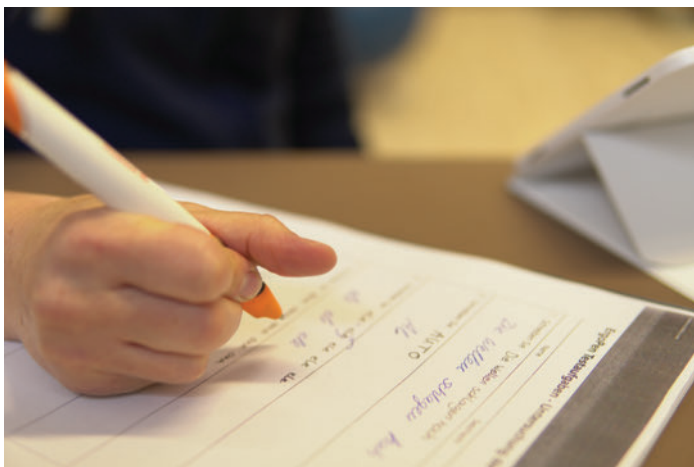
► Abb. 2 Durch die ungünstige Stifthaltung belastete Frau S. die Fingerflexoren beim Schreiben mehr als nötig. Weil sie das Daumenendgelenk in Streckung hielt, konnte der lange Daumenbeuger die Haltung des Stiftes nicht genug unterstützen.

Vorrang sollten also immer Maßnahmen der Physio- und Ergotherapie bestehend aus einer Schienenversorgung, Edukation, Manueller Therapie und Bewegungsübungen haben [5]. In Bezug auf die genannten Maßnahmen fanden Fernández-de-Las Peñas et al. in ihrer Studie heraus, dass eine Operation zu keinem Zeitpunkt (1, 3, 6, 12 Monate) der Manuellen Therapie (3 Behandlungen zur Desensibilisierung und Neuromobilisation des N.