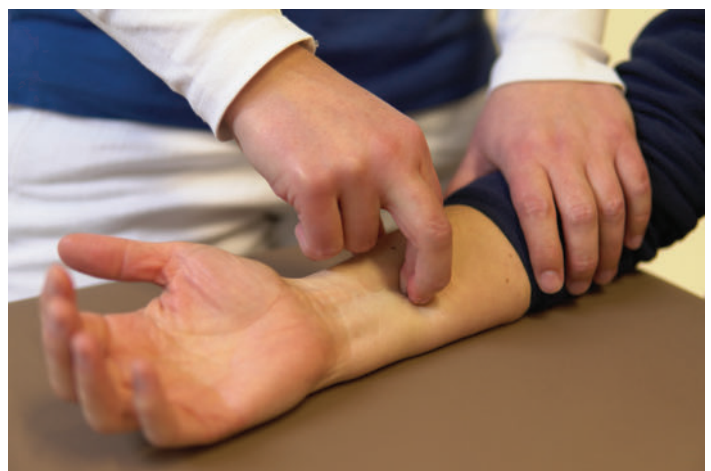
► Abb. 3 Therapeuten können Querfraktion bei Sehnencheidenentzündungen zur Tonussenkung und Adhäsionslösung einsetzen.

Ziel war es also, die hypertonen Fingerflexoren beim Schreiben zu entlasten und dadurch zur Korrektur der Grafomotorik beizutragen. Um den FPL gezielt zu trainieren, nutzten wir das Brunelli-Plättchen insbesondere beim Einsatz von feinmotorischen Spielen (► Abb. 6 ). Zu