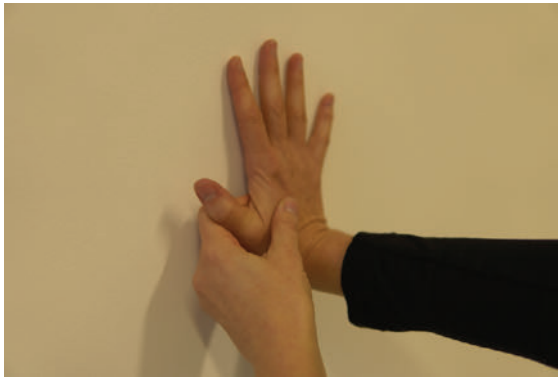
► Abb. 4 Die myofasziale Dehnung des Retinaculum flexorum eignet sich optimal als Eigenübung.