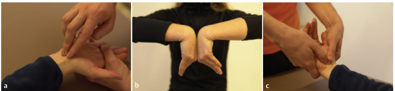
► Abb. 1 Provokationstests für den N. medianus im Karpaltunnel. a Hoffmann-Tinel-Zeichen (Beklopfen des Nerven). b Phalentest (Kompression durch Verengung des Karpaltunnelquerschnitts). c Durkan-Test (äußere Kompression durch den Untersucher).

Weiterhin sind Provokationstests (Hoffmann-Tinel-Zeichen, Phalen-Test und Durkan-Test, ► Abb. 1 ) zur Diagnostik empfehlenswert. Während Therapeuten beim Tinel-Zeichen den Karpaltunnel in leicht vorpositionierter Dorsalextension der Hand mehrfach mit ihren Fingern beklopfen, flektieren Patienten beim Phalen-Test ein- oder beidseitig aktiv ihr Handgelenk für mindestens eine Minute. Beim Durkan-Test komprimiert der Untersucher den Karpaltunnel für etwa 30 Sekunden mit beiden Daumen. Hierbei befindet sich der Ellenbogen des Patienten in Extension, der Unterarm in Supination und das Handgelenk in ca. 60° Palmarflexion. Die Tests gelten als positiv, wenn sie die für den Patienten typischen Parästhesien reproduzieren. Die jeweiligen Ergebnisse