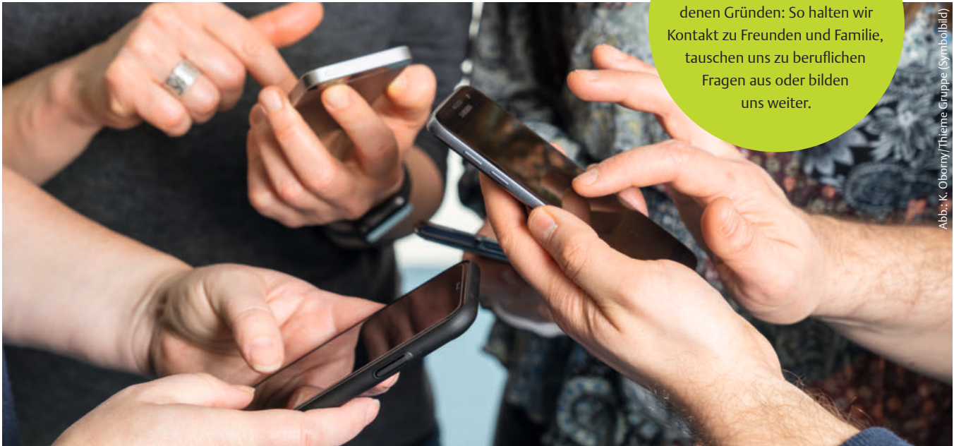
Abb.: K. Oborny/Thieme Gruppe (Symbolbild)

vernetzt sind wir aus verschiedenen Gründen: So halten wir Kontakt zu Freunden und Familie, tauschen uns zu beruflichen Fragen aus oder bilden uns weiter.