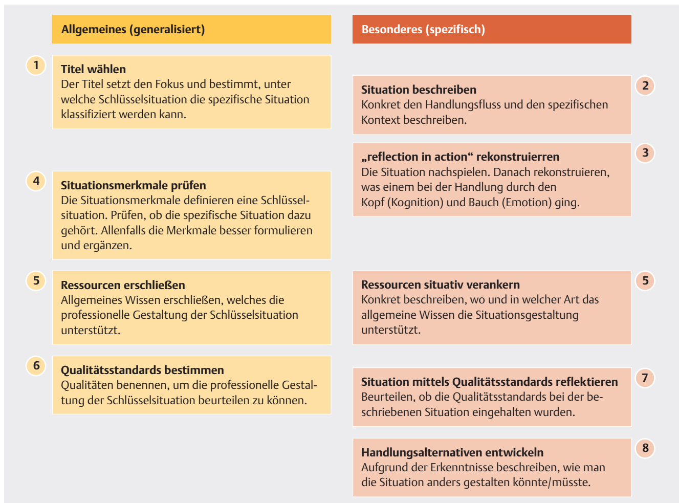
► Abb. 2 Relationierung von Allgemeinem und Besonderem beim Wechselspiel von generalisierbaren und spezifischen Aspekten des Reflexionsmodells Schlüsselsituationen

Variante steht die Wahrnehmung und vermutlich der Bereich der Kommunikation im Vordergrund. Beim zweiten Titel liegt der Fokus auf dem medizinisch-gynäkologischen Aspekt der Untersuchung. Vermutlich wird es zwischen den beiden eine gewisse Schnittmenge geben, aber der definierte Gegenstandsbereich ist einmal eher psychologischer und ein anderes Mal eher medizinischer Natur. Diese Tatsache wird die Wahl meiner Wissensquellen, ebenso wie die Kriterien meiner Qualitätsansprüche beeinflussen.