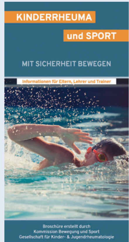
► Abb. 2 Informationsflyer für Eltern, Sportlehrer und Trainer.