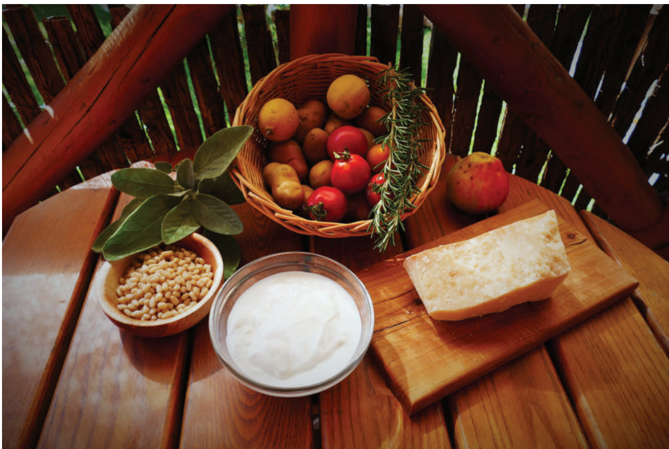
► Abb. 1 In einer gesunden Mischkost findet sich für den gesunden Menschen ein ausgewogenes Maß an Eiweißen. Die mediterrane Ernährung bietet eine gute Orientierung.

Aminosäuren sind hauptsächlich als Eiweißbausteine bekannt, erfüllen jedoch auch wesentliche Aufgaben im Stoffwechsel, da sie als Vorstufen für bedeutende biologische Verbindungen wie Neurotransmitter, Immunfaktoren oder Verdauungsenzyme fungieren. Weil die Stoffwechselwege ineinandergreifen, hängt die Effektivität einzelner Aminosäuren oft von anderen nutritiven Faktoren und einer intakten Enzymfunktion ab. Dies kann bei verschiedenen Erkrankungen von Bedeutung sein. Kenntnisse über Aufgaben, Stoffwechsel und Vorkommen bestimmter Aminosäuren in Nahrungsmitteln ermöglichen eine gezielte Optimierung der Ernährung zur Erhaltung der Gesundheit und unterstützenden Intervention bei Krankheiten.