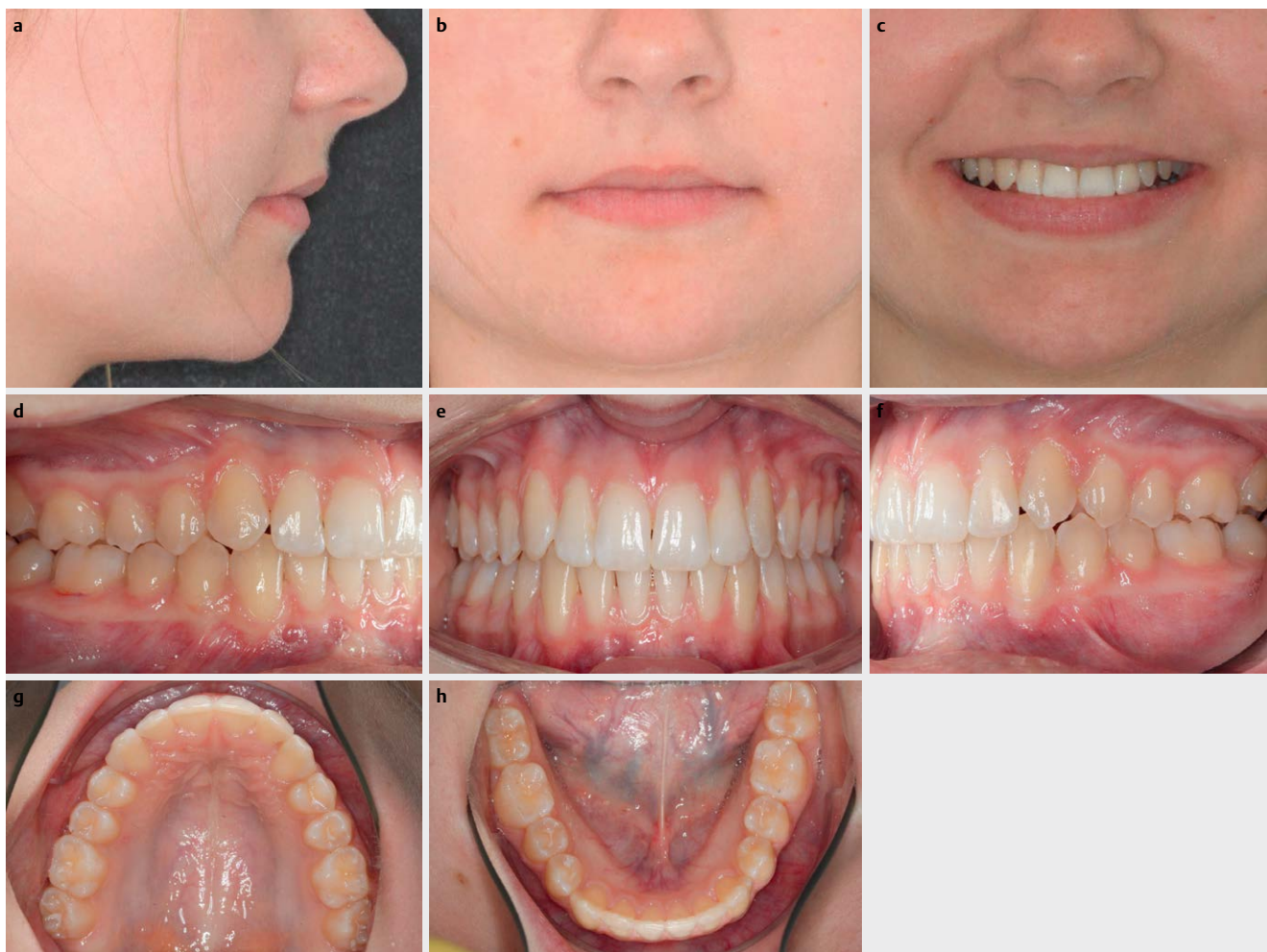
► Abb. 7 Klinisches Endergebnis mit ausgeformten Zahnbögen und Klasse-I-Verzahnung mit physiologischem Overjet und Overbite sowie korrigierter Mittellinie.

Die Alignertherapie hat sich innerhalb der vergangenen 2 Jahrzehnte in der Kieferorthopädie etabliert. Während sich das Indikationsspektrum zunächst auf geringe Lücken- und Engstände beschränkte [12], werden heute, 20 Jahre nach Einführung des Invisalign-Systems, zunehmend auch komplexere Behandlungen bei Erwachsenen sowie Kindern und Jugendlichen durchgeführt. Korrekturen in der Transversal-, Sagittal- und auch Vertikalebene sind bei präziser Planung unter Berücksichtigung der biologischen Gegebenheiten des Patienten und der biomechanischen Prinzipien in der kieferorthopädischen Behandlung möglich [13].