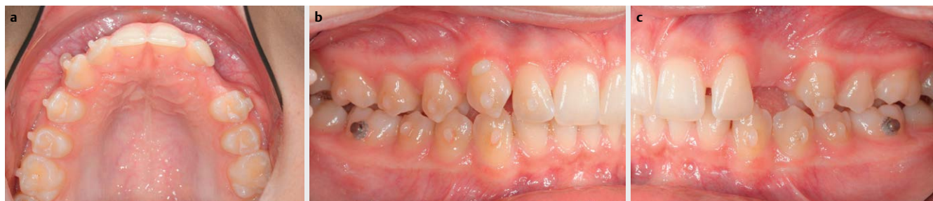
► Abb. 4 Zwischendiagnostik nach der vollständigen Distalisierung von 16 und 15 mit Super-Klasse-I-Molarenverzahnung rechts und links sowie ausreichendem Platzangebot für die Einstellung des Zahnes 23 nach 37 Alignern.