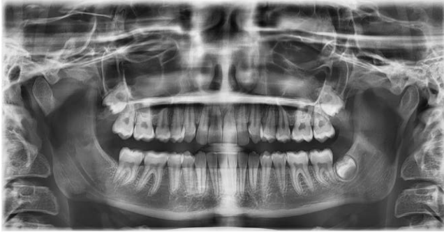
► Abb. 8 Panoramaschichtaufnahme nach Behandlungsabschluss und nach Einstellung des retinierten und verlagerten Zahnes 23. Die Extraktion der Weisheitszähne 18, 28 und 38 wurde anschließend empfohlen.

Die Patienten genießen den Vorteil einer nahezu unsichtbaren Behandlung, die zusätzlich mit einer verbesserten Hygienefähigkeit einhergeht, sind auf der anderen Seite aber auch zu einer hervorragenden Compliance aufgefordert, ohne welche eine Alignerbehandlung nicht durchführbar wäre.