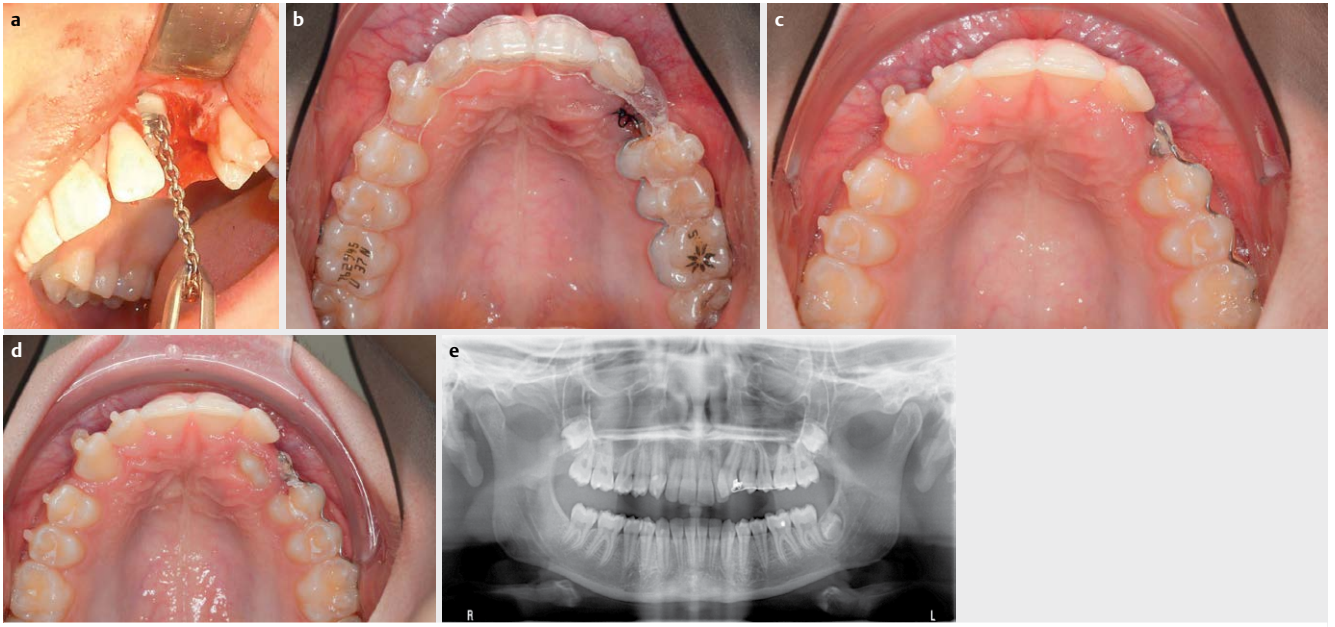
► Abb. 5 a Chirurgische Freilegung und Applikation einer Zugkette, b initiale Extrusion mithilfe eines palatinal befestigten Teilbogens von 24–26 und Aligner 37 in situ; c und d Wechsel auf einen bukkal befestigten Teilbogen (regio 24–26) und abschließende Extrusion des Zahnes 23 in die Mundhöhle, e PSA zur Zwischendiagnostik.