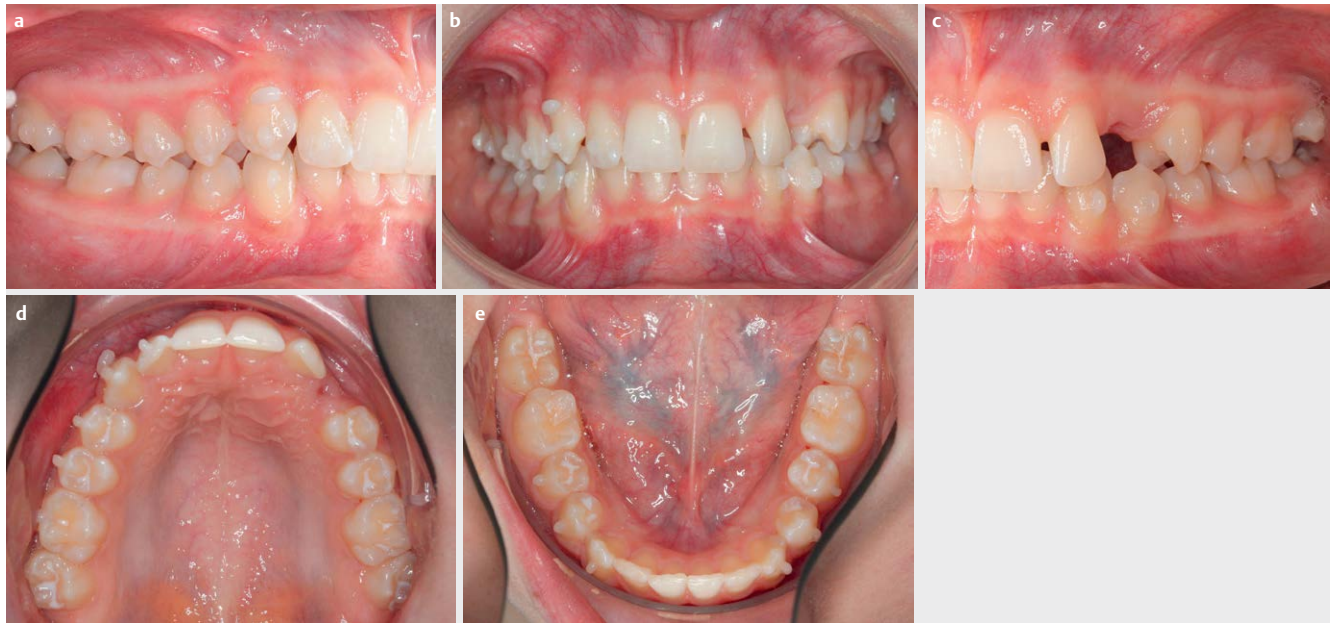
► Abb. 3 Klinisch intraoraler Befund nach Extraktion des Zahnes 63 und nach Applizieren der notwendigen Attachments und Hooks im Rahmen der Aligner-Therapie.

Beim Einsetzen der ersten Aligner wurde zusätzlich ein Knöpfchen auf Zahn 36 und 46 ergänzt, sowie Verankerungsattachments auf 24 und 27 und ein Precision Cut auf Zahn 24. Die sequentielle, durch intermaxilläre Klasse-II-Gummizüge unterstützte Distalisierung der oberen Seitenzahnreihen diente zum Platzgewinn im Frontzahnbereich und insbesondere zur weiteren Öffnung des Durchbruchspfades des Zahnes 23. Die Aufrichtung der Oberkiefer-Frontzähne wurde durch Power Ridges unterstützt. Im Unterkiefer wurden die Spee-Kurve nivelliert und Einzelzahnabweichungen korrigiert. Insgesamt wurden für die erste Behandlungsphase 64 Aligner geplant, die wöchentlich gewechselt wurden.