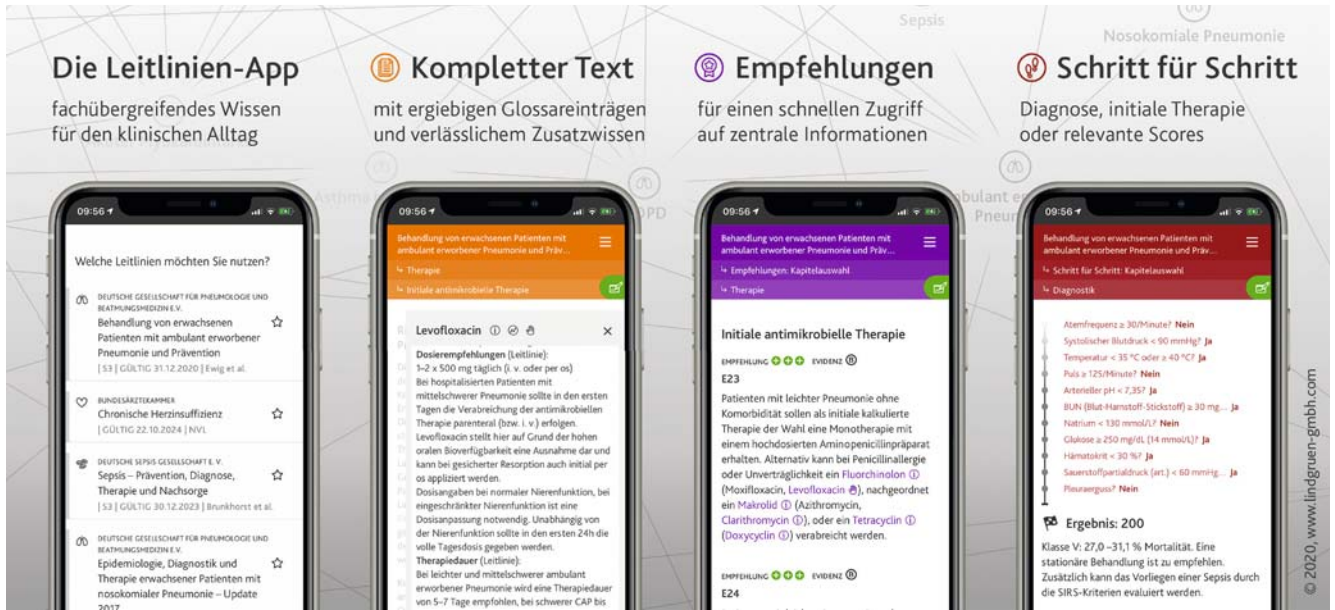
► Abb. 2 Verschiedene Modi zur Nutzung der Smartphone-App Leila.

ben. Diese Zahl war am höchsten bei der Lungenfibrose mit 3 von 10 Personen; bei Asthma war es nur eine von 10 Personen.