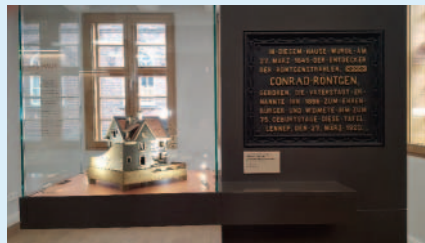
Einblick in die Ausstellung im Erdgeschoss mit der originalen Erinnerungstafel des Röntgen-Geburtshauses von 1920.