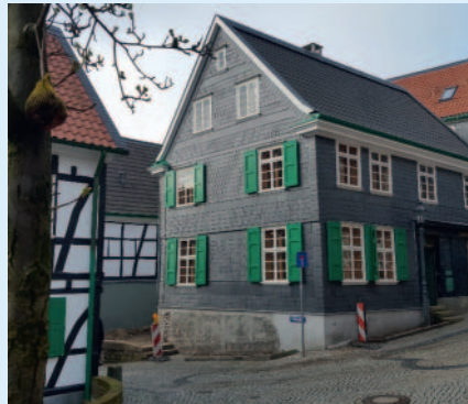
Die renovierte Außenfassade des Geburtshauses von Wilhelm Conrad Röntgen in Remscheid-Lennep.

Seit Ende Juni stehen neugierigen Besucherinnen und Besuchern die Türen des Röntgen-Geburtshauses in Remscheid-Lennep wieder offen – pünktlich zum Start der Sommerferien in Nordrhein-Westfalen. Ohne Voranmeldung können Interessierte dort jeden Donnerstag von 12 bis 18 Uhr kostenlos mehr über den Wissenschaftler und ersten Nobelpreisträger für Physik, Wilhelm Conrad Röntgen, erfahren. Für die Ausstellungsöffnung wurde in Absprache mit dem Gesundheitsamt ein umfangreiches Hygienekonzept entwickelt. „Zu diesem Konzept gehört unter anderem, dass sich maximal sechs Personen gleichzeitig in der Ausstellung aufhalten dürfen – dabei ist ein Mund-Nasenschutz obligatorisch. Des Weiteren reinigen wir die Displays an den interaktiven Stationen regelmäßig mit einem speziellen Desinfektionsmittel. Auf Wunsch händigen wir den Besucherinnen und Besuchern gerne Einmalhandschuhe aus. Wir sind also bestens ausgestattet und freuen uns, wieder Besucherinnen und Besucher begrüßen zu