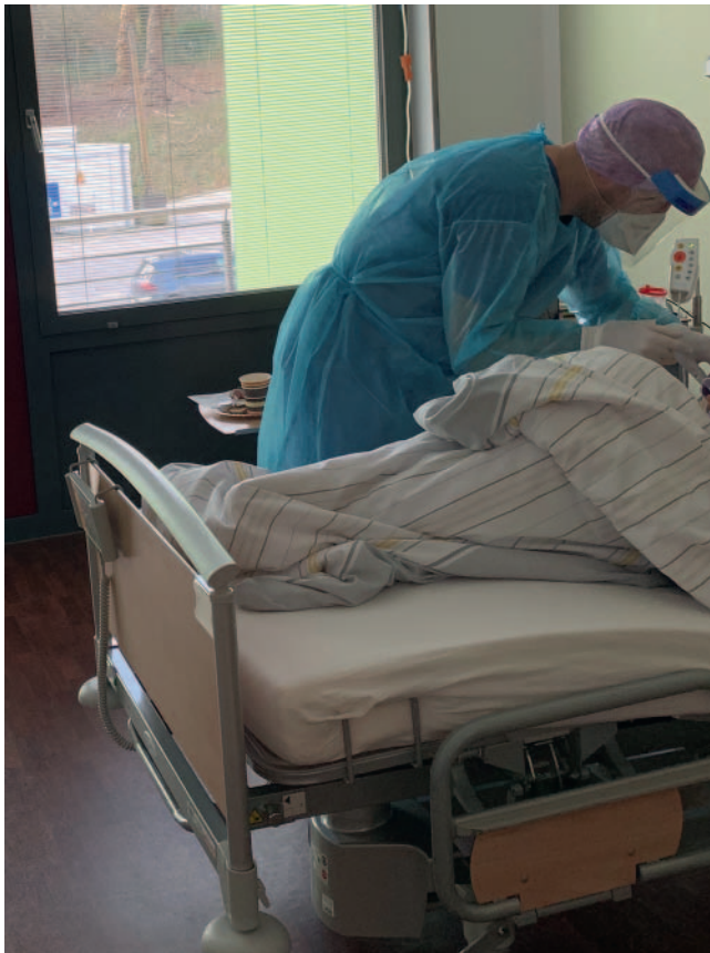
► Abb. 2 Deutlich erhöhter Aufwand in der postoperativen Nachbetreuung unter voller persönlicher Schutzausrüstung.

lauf gestaltete sich komplikationslos, sodass die Patientin unter antibiogrammgerechter Antibiose zwei Tage nach der Operation in die häusliche Quarantäne entlassen werden konnte.