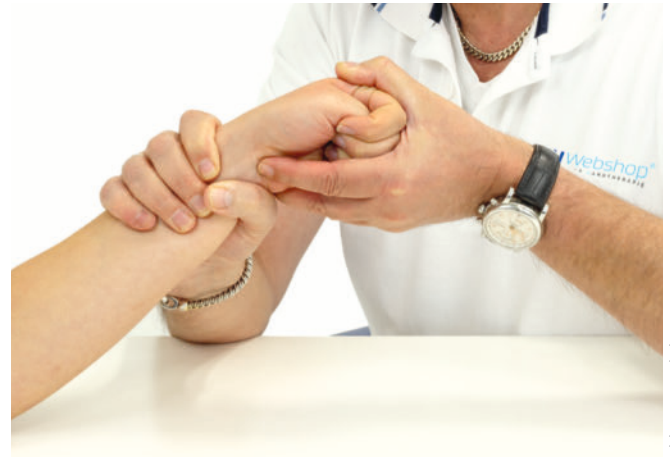
ABB. 3 Beim Eichhoff-Test umschließt der Patient seinen Daumen mit der Faust. Dann bewegt der Therapeut die Hand schnell nach ulnar. Auch hier sprechen Schmerzen für die Sehnenscheidenentzündung.

eine schmerzhafte isometrische laterale Flexion des Unterarms auf eine Ansatzendopathie des M. brachioradialis am Proc. styloideus radii hin [20]. Eine schmerzhafte Radialduktion im Gegensatz zur Ulnarduktion kann eine Problematik im radialen Handgelenk, beispielsweise eine SST-Arthrose, zur Ursache haben [4, 7].