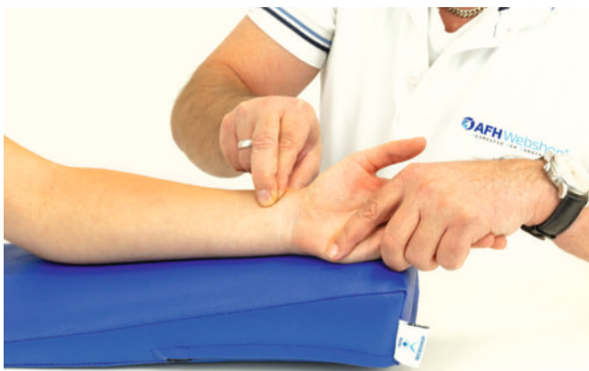
ABB. 4 Bei der Querfriktion aktiviert der Therapeut den Stoffwechsel und löst pathologisches Gewebe.