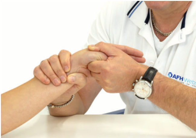
ABB. 2 Der Untersucher führt beim Finkelstein-Test den Daumen des Patienten ruckartig nach ulnar. Ist dieser Dehnreiz schmerzhaft, ist der Test positiv und deutet auf Morbus de Quervain hin.