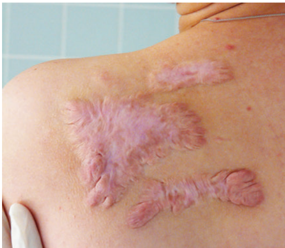
► Abb. 1 Flächiges (schweres) Narbenkeloid an der dorsalen Schulter.

Von Problemnarben sprechen wir beim Vorliegen von Schmerzen, Hypertrophie oder Keloidbildung.