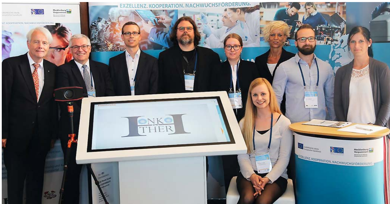
► Abb. 2 Vertreter des ONKOTHER-H Konsortiums bei der 15. Nationalen Branchenkonferenz Gesundheitswirtschaft.

Therapieansätzen entstehen. Dazu kommen zunächst geeignete Zellkulturmodelle für das Plattenepithelkarzinom sowie für das kutane Melanom zum Einsatz. Anschließend werden die Ergebnisse in der In-vivo-Situation am Mausmodell validiert.