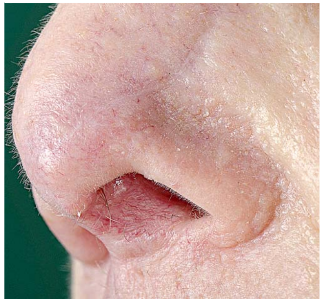
► Abb. 3 Multiple Papeln in der Nasolabialfalte.

Dr. Rütten/Dermatopathologie Friedrichshafen zur Mitbegutachtung übersandt, der den Verdacht auf das Vorliegen eines basaloiden follikulären Hamartoms äußerte.