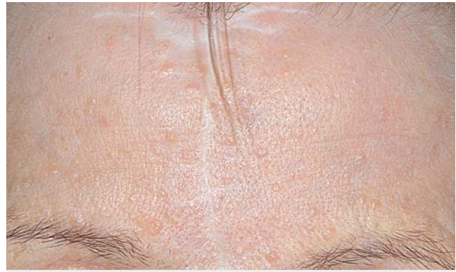
► Abb. 2 Multiple Papeln an der Stirn.