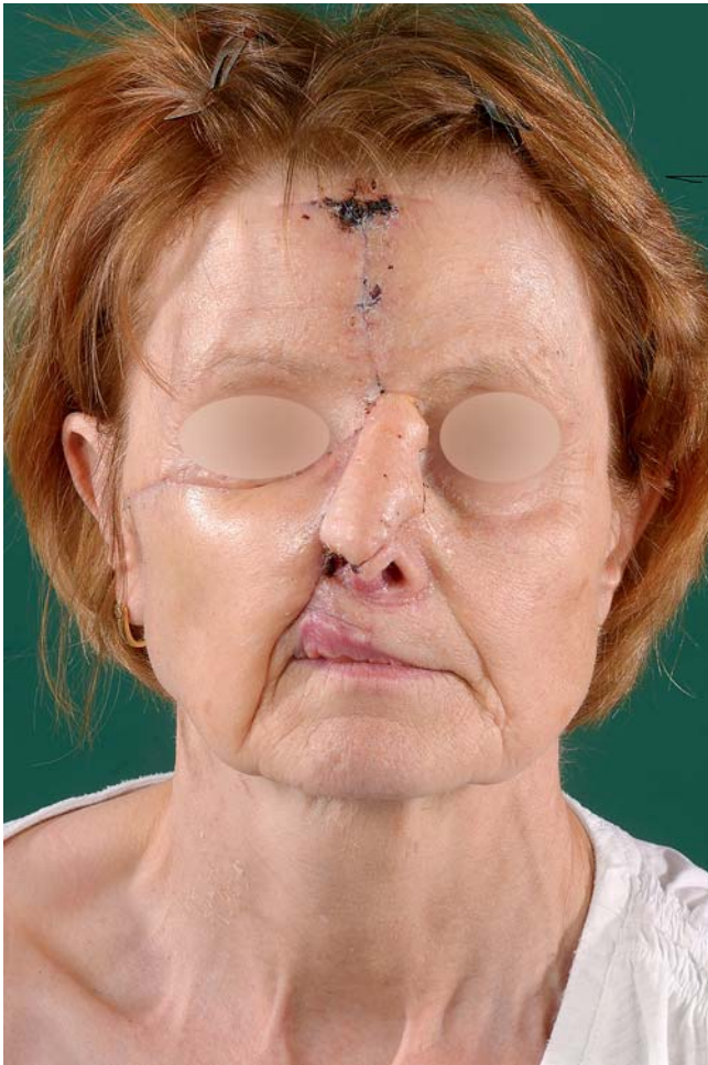
► Abb. 1 Klinisches Bild bei der Erstvorstellung nach erfolgter Resektion und plastischer Rekonstruktion.