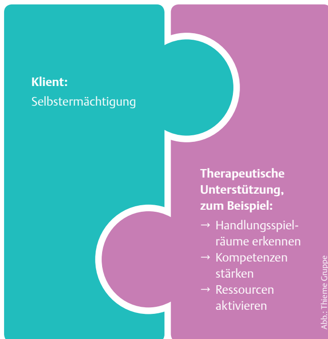
ABB. 1 Empowerment als zweigeteiltes Konzept

Die vier Kinder aus unserem Beispiel haben sich als Gruppenprojekt den Nachbau eines Activity-Spiels ausgesucht. Dazu erstellen sie Spielkarten, einen Spielplan sowie eine Aufbewahrungsbox. In der Einführungsrunde legen sie ihre individuellen Annäherungsziele für die Stunde fest. Annäherungsziele dienen dazu, Grundbedürfnisse zu befriedigen und gewünschte Veränderungen herbeizuführen. Sie