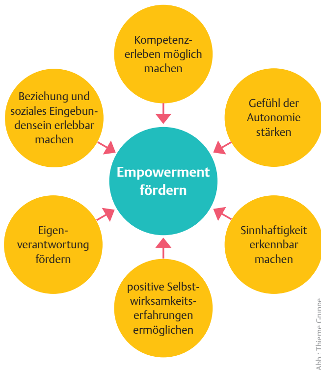
Abb.: Thiemer Gruppe