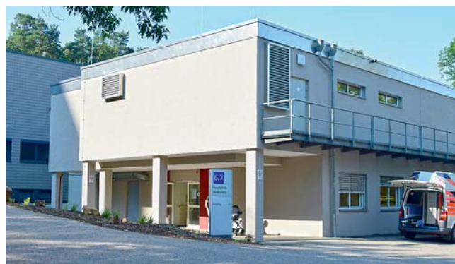
► Abb. 1 Teilneubau der dermatologischen Hochschulambulanz und des neuen OP-Trakts in Erweiterung der Kombiklinik im Gebäude 6 auf dem Campus Homburg.