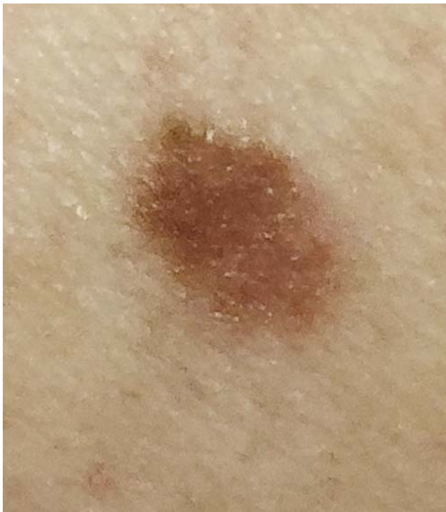
► Abb. 2 Dysplastischer Nävus.