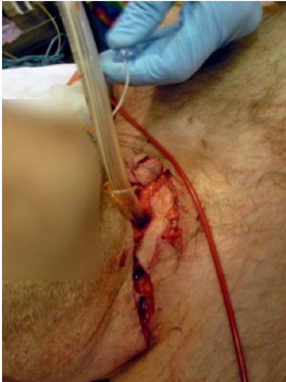
► Abb. 1 Extremform einer alternativen Atemwegssicherung: M56J, Schnittverletzung am Hals in suizidaler Absicht mit einem Küchenmesser. Direkte Insertion des Beatmungstubus in die freiliegende Trachea.

ternative Methoden zur Atemwegssicherung (siehe oben) in Betracht gezogen werden. Die Videolaryngoskopie stellt eine gute Option zur Verbesserung der Einstellbarkeit der Stimmbandebene dar und sollte deshalb auch in der Präklinik auf notarztbesetzten Einsatzmitteln vorgehalten werden [5].