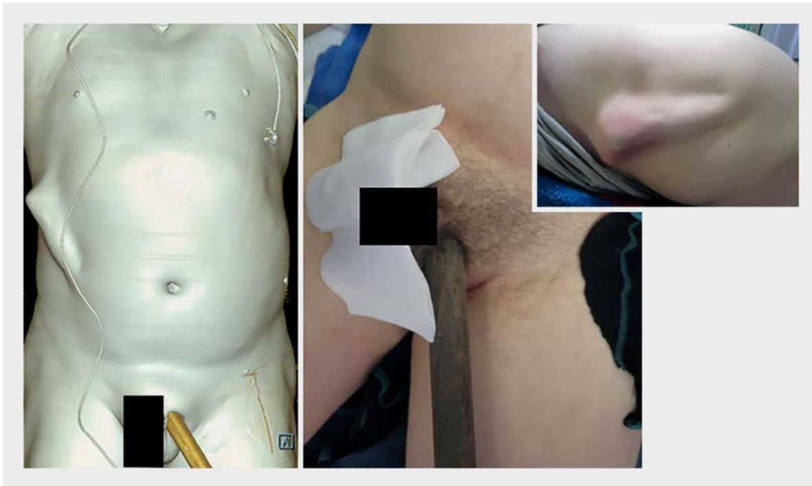
► Abb. 3 Fall eines 47-jährigen Mannes mit Pfählungsverletzung: Belassung des Fremdkörpers und Polsterung bis in den Operationssaal.