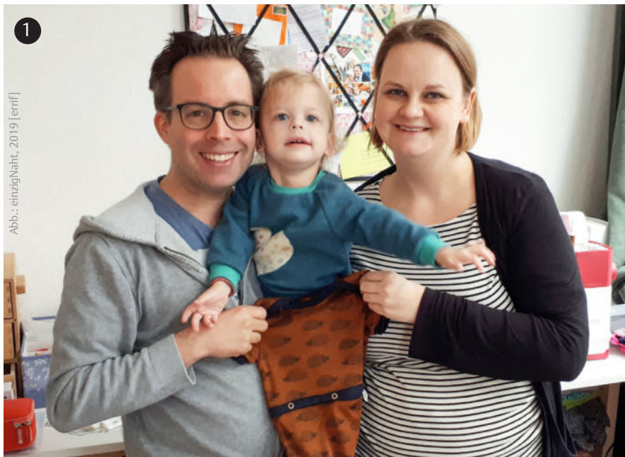
Abb.: einzigNaht, 2019 [errif]