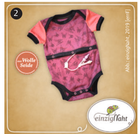
Abb.: einzigNaht, 2019 [errif]