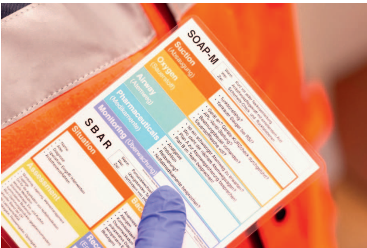
► Abb. 3 Die SOAP-M-Taschenkarte ermöglicht kurz vor Narkoseeinleitung den letzten Check und erhöht die Durchführungssicherheit. S = Suction (Funktion, Absaugkatheter), O = Oxygen (Präoxygenierung), A = Airway (Atemweg, Plan B und C), P = Pharmaka, M = Monitoring (sind alle Messwerte vorhanden und aktuell?).

mögliche räumliche Positionierung der Einsatzkräfte im Rettungswagen (RTW) zeigt ► Abb. 2 .