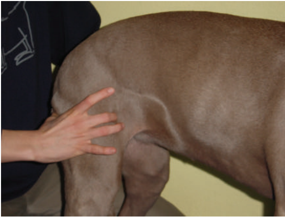
► Abb. 1 Palpation des MA31: am kranialen Rand des Oberschenkels, am Rand des obersten Drittels zwischen Patella und Tuber coxae, zwischen M. sartorius und M. tensor fasciae latae.