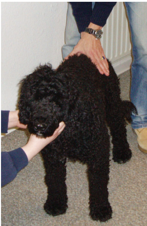
► Abb. 6 Hände übereinander flach auf das Kreuzbein legen und den Beckengürtel leicht wippend nach unten drücken.