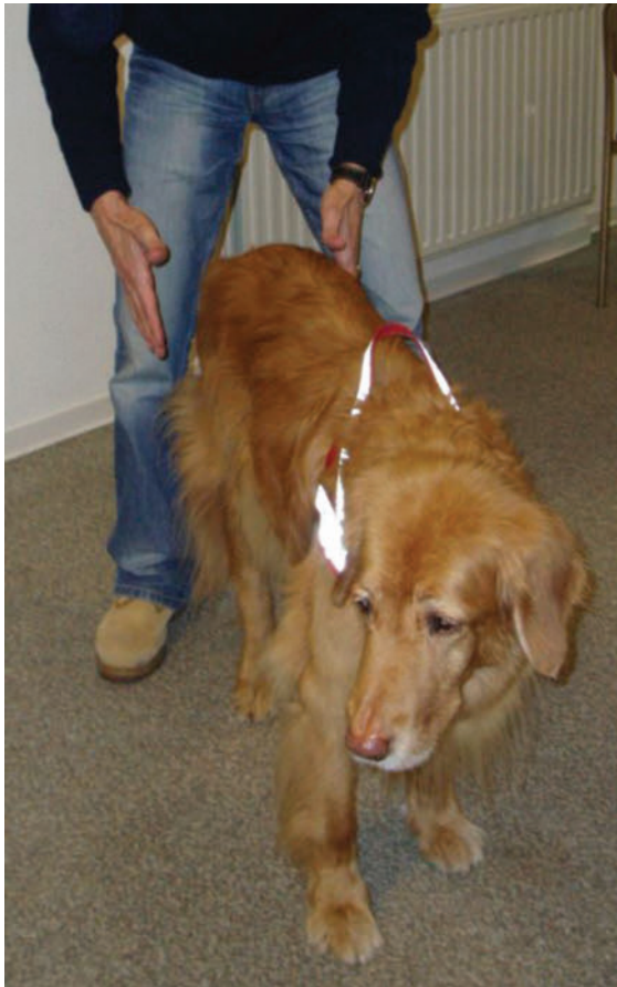
► Abb. 4 Die Hände erzeugen einen wechselseitigen Druck seitlich gegen das Becken.