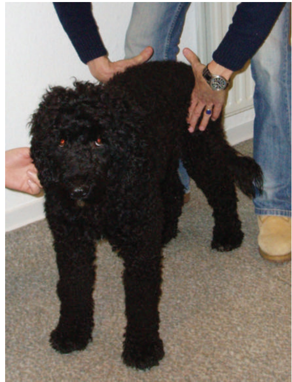
► Abb. 5 Die Hände von vorne an die Oberschenkel legen und leicht nach hinten drücken, sodass der Hund stehen bleibt, aber Widerstand gibt.