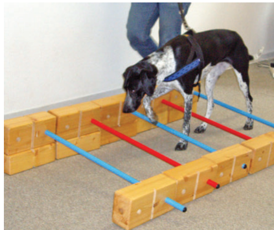
► Abb. 3 Beim Cavaletti-Training sollte der Hund im Schritt über die Stangen steigen und nicht darüber springen.