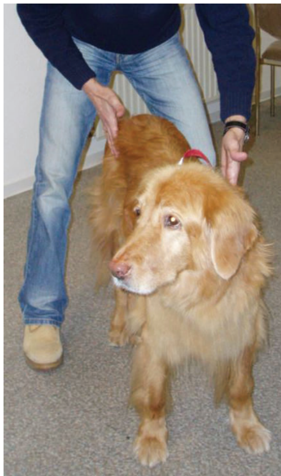
► Abb. 7 Eine Hand seitlich flach an das Becken, die andere an das kontralaterale Schulterblatt legen und gleichzeitig gegeneinander wippenden Druck ausüben.