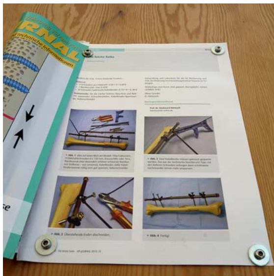
► Abb. 2 Mit der letzten Seite anschrauben ist auch eine Alternative.