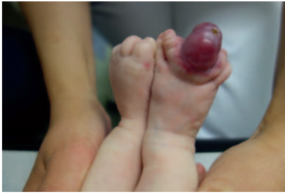
► Abb. 7 AVM Zeh und Vorfuß beim Neugeborenen.

schaft können die Progredienz teilweise massiv beschleunigen (► Abb. 6 ).