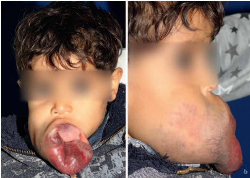
► Abb. 4a, b Sehr große VM im Kopf/Hals-Bereich.