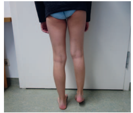
► Abb. 5 Spitzfußstellung bei FAVA in der Wadenmuskulatur (Caput mediale m. gastrocnemius).

Eine Sonderform der VM stellt die Fibro Adipose Vascular Anomaly (FAVA) dar, die ähnlich wie eine klassische VM aussieht, sich aber durch Sklerosierungen nicht gut behandeln lässt. Anhaltende Schmerzen führen zu Schonhaltungen, die bei betroffener Wade zu einem irreversiblen Spitz-