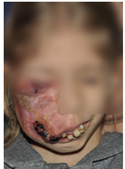
► Abb. 6 AVM Gesichtsschädel und Gesichteweichteile.

fuß führen können. Allein die chirurgische Resektion bringt hier Heilung (► Abb. 5 ).