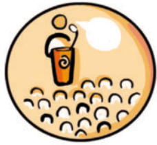
Abb.: Grafikbüro S. Schaaf