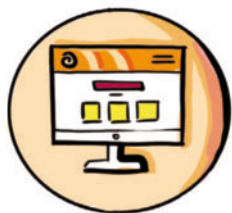
Abb.: Grafikbüro S. Schaaf

Hier kommen fünf Tipps für die erfolgreiche Mitarbeitersuche.