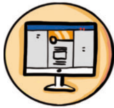
Abb.: Grafikbüro S. Schaaf

Verlinken Sie auf diese Website in allen Ihnen zugänglichen Social-Media-Kanälen wie Facebook, Instagram, YouTube etc. Und bitten Sie aktiv darum, dass dieser Link geteilt wird, um Ihre Reichweite zu erhöhen. Trauen Sie sich das einfach. Es geht um Ihr Unternehmen und Ihre Klienten und Patienten.