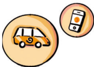
Abb.: Grafikbüro S. Schaaf

Neben den genannten fachspezifischen Gruppen können Sie auch die Facebook-Algorithmen für sich arbeiten lassen und eine kostenpflichtige Anzeige erstellen (lassen), die „lasergenau“ Ihre Zielgruppe erreicht. Hier ist die Hilfe eines Profis mehr als hilfreich. Lassen Sie sich nicht von den Kosten abschrecken. Eine nicht besetzte Stelle kostet in 150 Tagen dramatisch viel mehr Geld als eine professionelle Hilfe bei der Mitarbeitersuche. Beherrzigen Sie das.