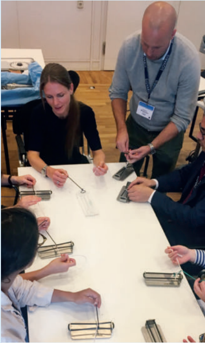
► Abb. 4 Erlernen von Knoten- und Nahttechniken am Modell.