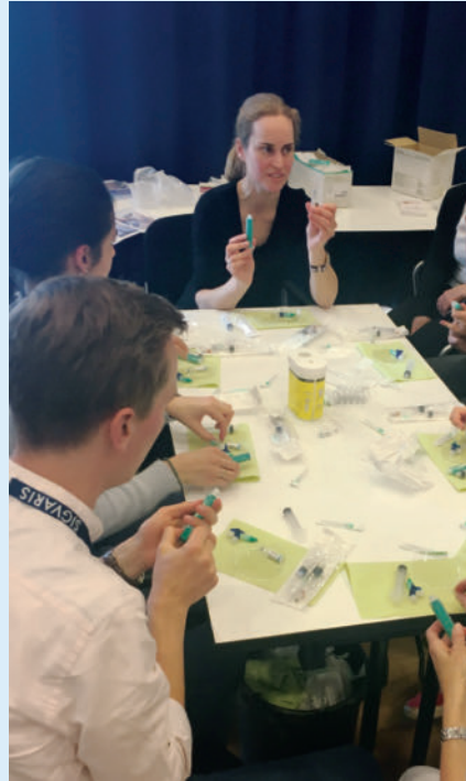
► Abb. 5 Herstellung von Sklerosierungsschaum.

den und fachliche Gespräche am Abend bei der Phlebo-Party im MOVIE geführt werden. Für das leibliche Wohl sowie für die Übernachtung wurde gesorgt. Die Anreise erfolgte auf eigene Faust. Finanziell unterstützt und organisiert wurde der Workshop durch die Deutsche Gesellschaft für Phlebologie sowie von Sigvaris.