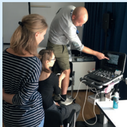
► Abb. 2 Duplexsonografie der Beinvenen durch die Kursteilnehmer.