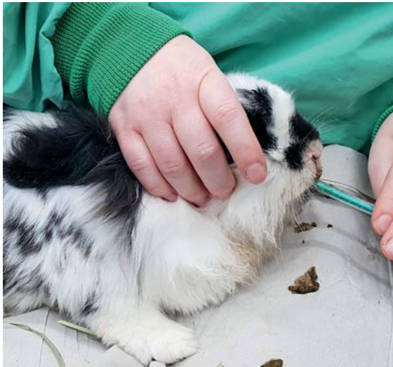
► Abb. 4 Handfütterung eines Kaninchens als Vorbereitung auf eine Anästhesie.