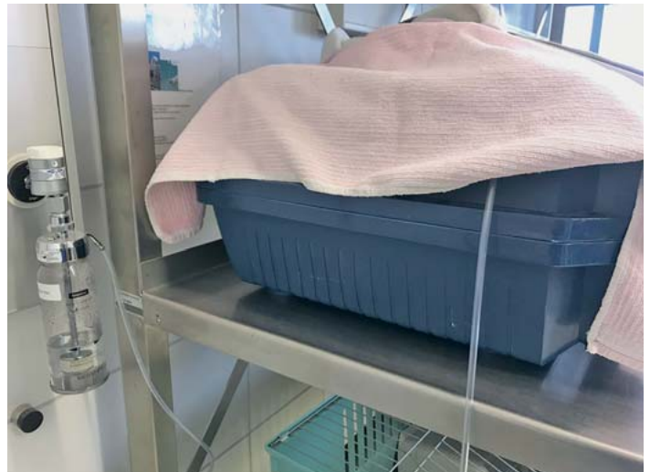
► Abb. 5 Stressfreie Präoxygenierung vor der Einleitung der Anästhesie in einer abgedeckten Transportbox.