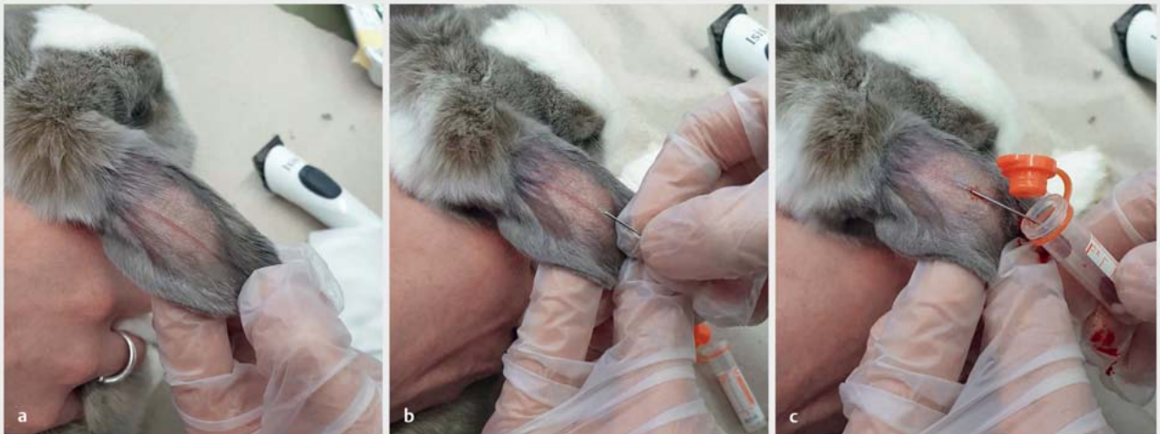
► Abb. 3 Blutentnahme bei einem Kaninchen an der A. auricularis als Teil der präanästhetischen Untersuchung.