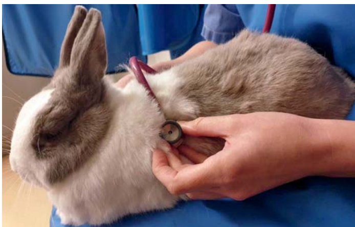
► Abb. 1 Auskultation der Lunge und des Herzens bei einem Kaninchen als Teil einer präanästhetischen Untersuchung.

Viele Kaninchen leiden an subklinischen Atemwegsinfektionen . Diese können während der Narkose, aufgrund eines vermindert funktionalen Lungengewebes, zu einer respiratorischen Insuffizienz führen. Für die Auskultation des Herzens und der Lunge (► Abb. 1 ) muss sich genügend Zeit genommen werden. Aufgrund der sehr hohen Herz- und Atemfrequenz ist es bei den Heimtieren meist sehr schwierig Unregelmäßigkeiten zu hören.