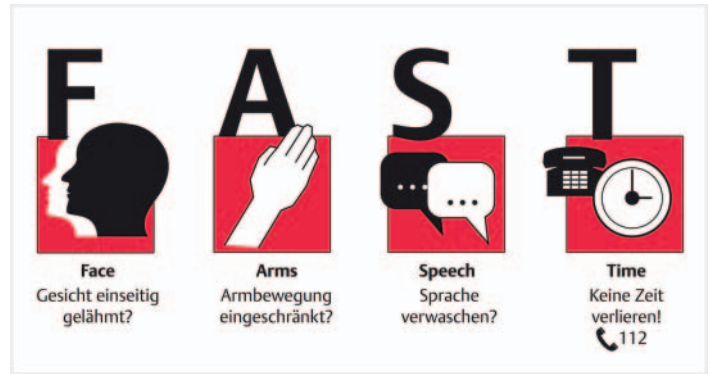
► Abb. 1 Face-Arm-Speech-Time-Test (FAST) zur Erkennung eines akuten Schlaganfalls [1].

Zunächst müssen die Symptome des Schlaganfalls beim Auftreten des Ereignisses vom Patienten selbst oder den Angehörigen erkannt werden. Dazu sind regelmäßig Aufklärungen bzw. Vorträge für die Bevölkerung notwendig und hilfreich. Erst mit einem frühzeitigen Notruf kann die Rettungskette rechtzeitig und schnell reagieren. Noch immer ist trotz vieler Aktivitäten und Öffentlichkeitsarbeit festzustellen, dass der Schlaganfall nicht immer als Notfall erkannt wird. Für die Erkennung der typischen Symptomatik eines Schlaganfalls wird der „Face-Arm-Speech-Time“-Test (FAST) empfohlen [5]. Dieser bietet eine hohe Sensitivität, aber eine niedrige Spezifität und