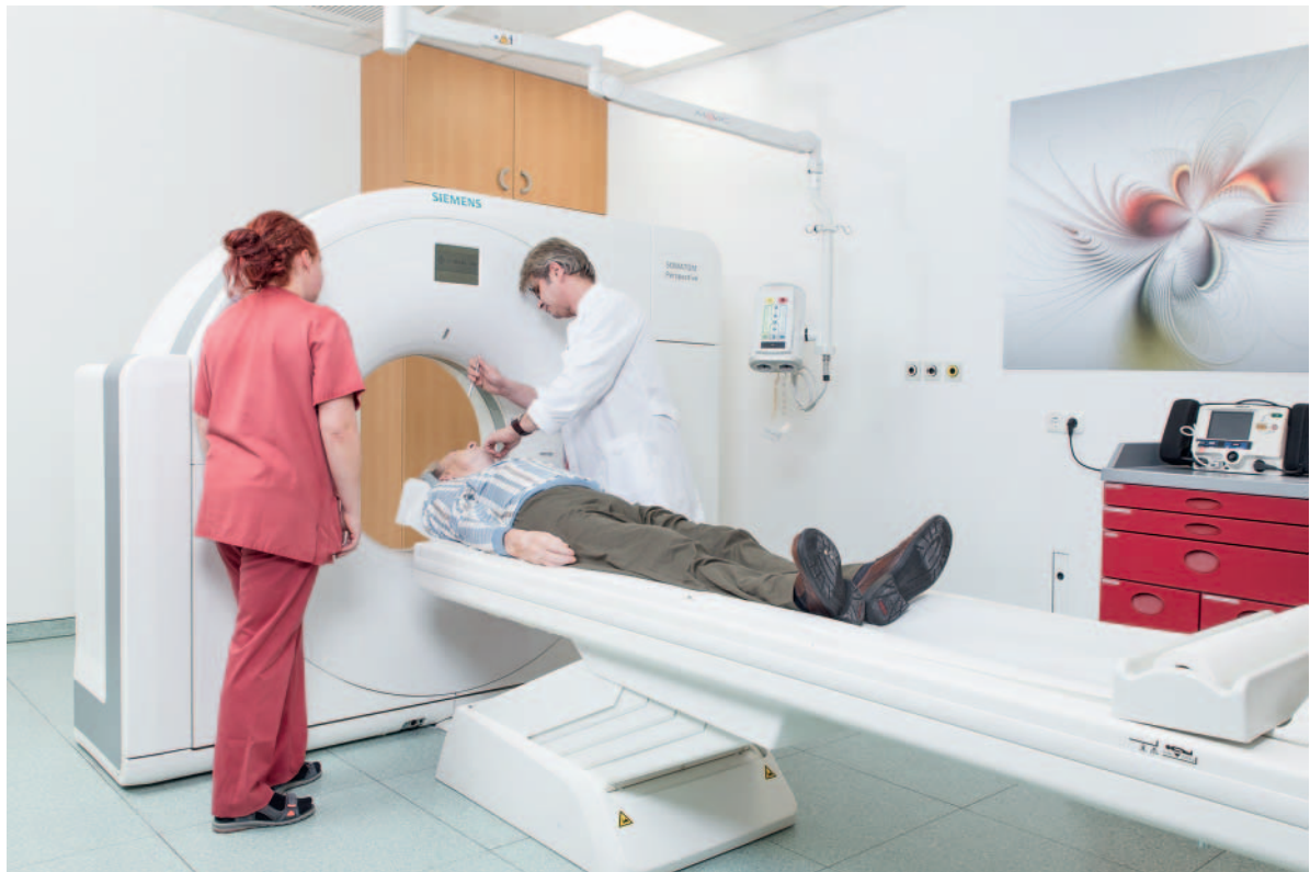
► Abb. 3 Ziel: Vermeidung von unnötigen Verzögerungen im Behandlungsablauf.