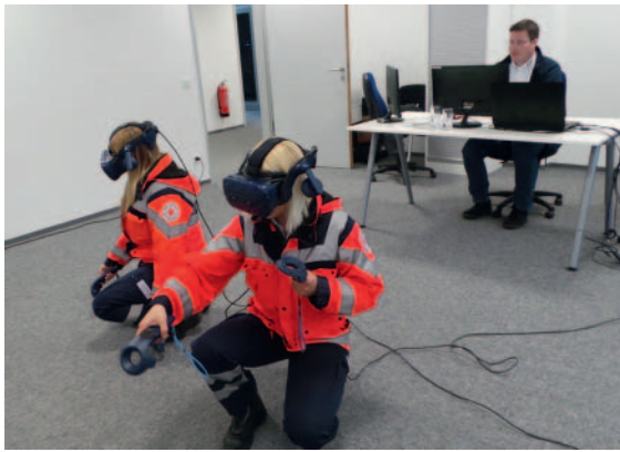
► Abb. 1 Trainer am Bildschirm und Auszubildende in der physikalischen Realität.

Eine solche VR-Simulationsumgebung wurde im Projekt EPICSAVE in einem interdisziplinären Konsortium entwickelt. Die VR ist als Mehrbenutzerumgebung konzipiert, sodass sie die Aneignung beruflicher Kompetenzen (z. B. klinische Entscheidungsfindung) zur rettungsdienstlichen Versorgung von Notfallpatienten im Team unterstützt [2]. Die Hardwareausstattung besteht für ein Teamtraining mit 2 Auszubildenden aus 2 VR-Brillen (hier: HTC Vive®), 4 Bediencontrollern sowie zwei PCs mit Display zur Steuerung der Simulation durch die Trainer (vgl. ► Abb. 1 ).