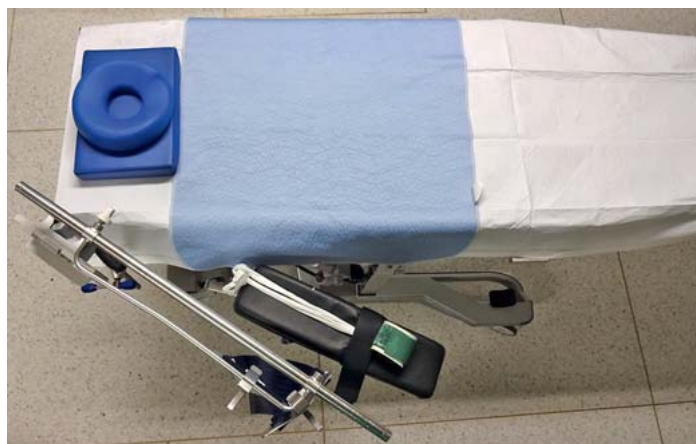
► Abb. 1 OP-Tisch mit Auflagen.

Um eine Auskühlung zu vermeiden, verwenden wir vorgewärmte Moltondecken zum Zudecken bereits beim Einschleusen des Patienten. Der Patient sollte während des Lagerungsvorganges so wenig wie möglich aufgedeckt werden. Bei längeren Eingriffen sollte ein geeignetes Wärmemanagement mit Wärmedecken und Wärmergeräten betrieben werden. Es wurde in verschiedenen Untersuchungen bewiesen, dass es einen direkten Zusammenhang zwischen der Auskühlung des Patienten und der Verträglichkeit der Narkose und der Infektionsrate gibt.