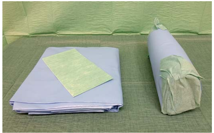
► Abb. 5 „Tübinger Bobbel“.