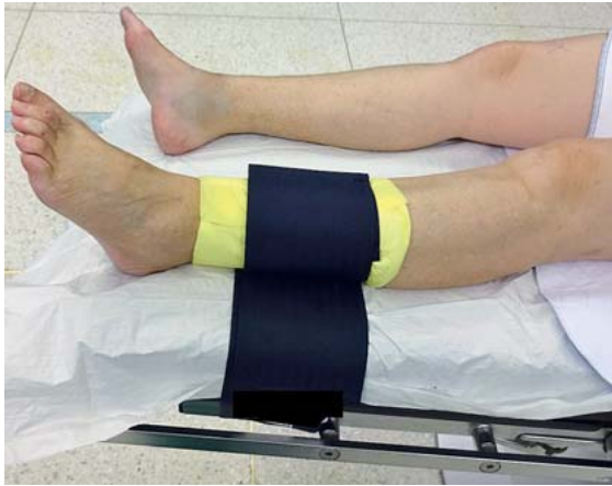
► Abb. 3 Beinfessel.

Eine Rasur des OP-Gebietes findet nicht mehr statt, das Kürzen der Haare mit einem Clipper reicht aus. Dies sollte idealerweise in der Narkoseeinleitung geschehen (Cave: Auskühlung). Der Patient wird grundsätzlich aus durchleuchtungstechnischen und hygienischen Gründen (weniger Metall im Strahlengang, Sterilabstand beim Abwasch- und Abdeckvorgang) unter Verwendung der Safetex-Unterlage vor Beginn des eigentlichen Lagerungsvorganges scherkräftefrei an das Fußende des OP-Tisches verbracht.