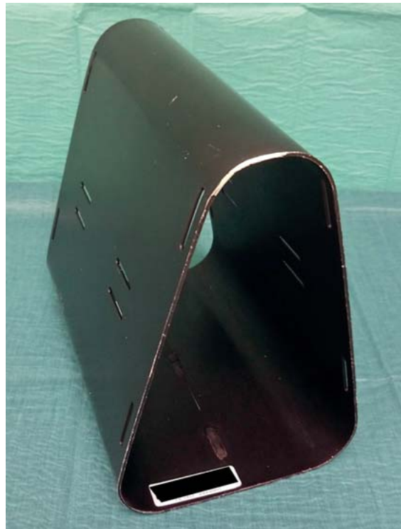
► Abb. 6 Aluminiumkniebank, sterilisierbar.