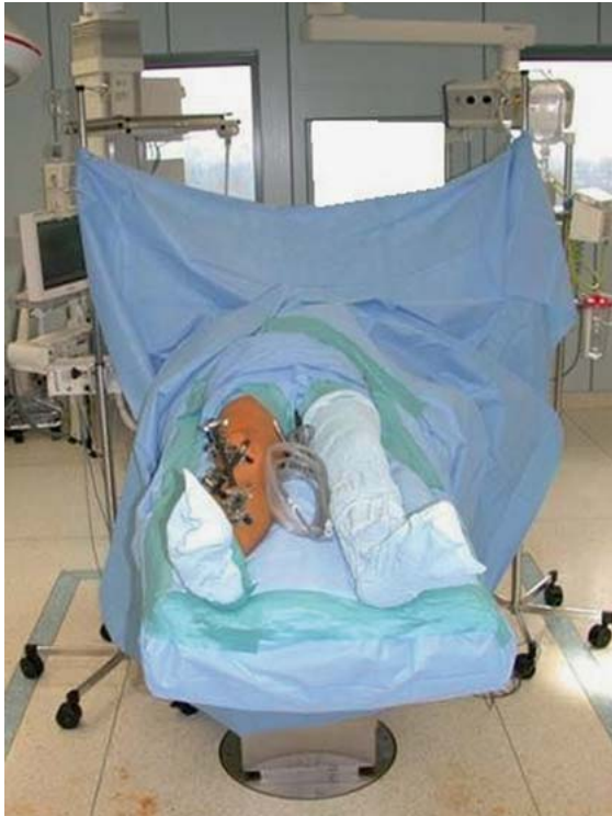
► Abb. 7 Beidbeinige Abdeckung.