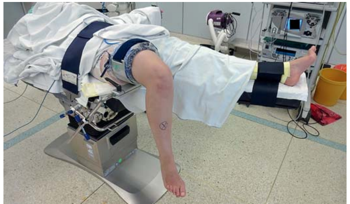
► Abb. 10 Arthroskopiebeinhalter hängendes Bein.

Kopf- und Armlagerung führen wir immer in enger Absprache mit dem Anästhesieteam und unter Berücksichtigung der individuellen Patientenbedürfnisse durch.