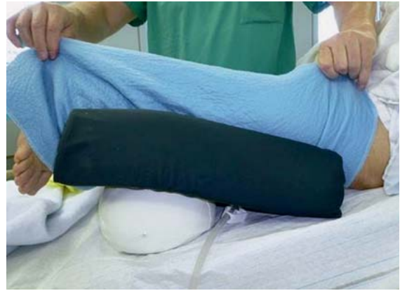
► Abb. 8 Weichschaum-C-Schiene.

Sowohl der Anästhesiearm als auch der andere Arm werden auf einer Armschiene mit Weichschaumauflage gelagert. Hier ist besonders auf die Ober- und Unterarmausrichtung (nicht über 90°) zu achten. Ebenso sollte das Schultergelenk frei beweglich gelagert sein und kein Zug auf den Plexus brachialis ausgeübt werden.