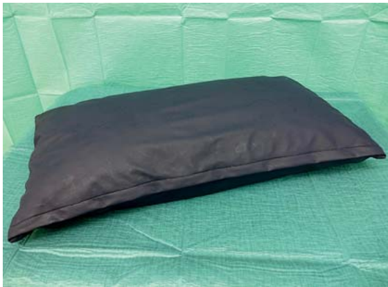
► Abb. 9 Flockenkissen.