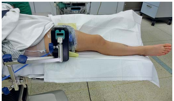
► Abb. 12 Gegenstütze als Hypomochlion.