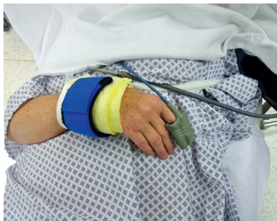
► Abb. 2 Klettarmfessel.