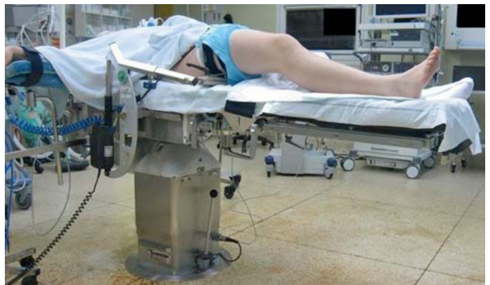
► Abb. 11 Hydraulisches Beinlagerungsaggregat.

Für kurze arthroskopische Eingriffe am Knie verwenden wir lediglich eine Gegenstütze auf Höhe der Blutsperrung am Oberschenkel. Die Beinplatte wird nicht entfernt, sondern nur etwas abgelassen (► Abb. 12 ).