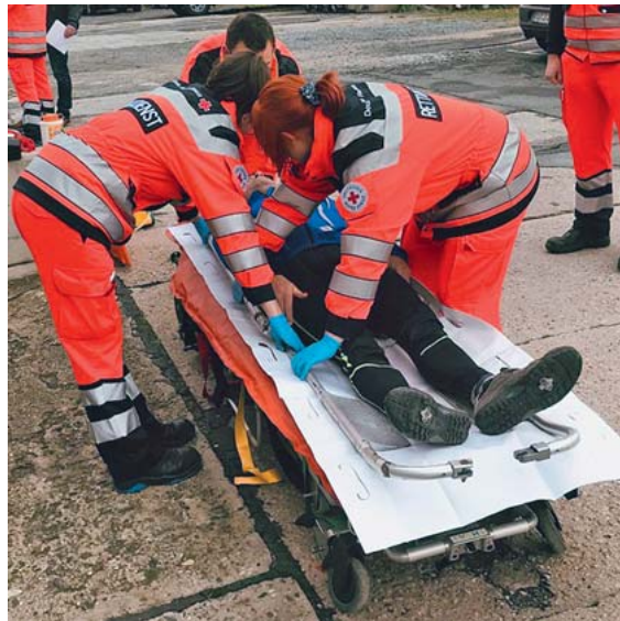
► Abb. 9 Nach Umlagerung des Patienten auf die bereits vorbereitete Vakuummatratze werden die Gurte entfernt, die Schaufeltrage entriegelt und beide Schaufelhälften vorsichtig seitlich herausgenommen.

Luft. Anschließend wird der Patient mittels Gurtsystem gesichert (► Abb. 10 ). Ist eine sichere Fixierung des Kopfes mit dem Kopfteil der Vakuummatratze möglich, so kann nun die MILS aufgehoben bzw. auf die zusätzliche Anwendung einer Zervikalstütze verzichtet werden.