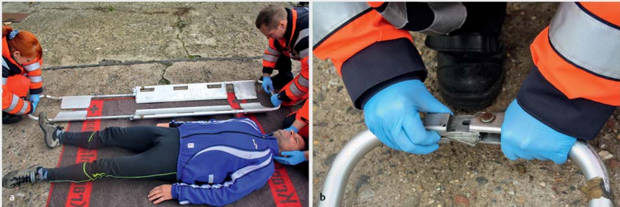
► Abb. 6 Benutzung der Schaufeltrage. a Anpassen der Länge der Schaufeltrage an die Körpergröße des Patienten. b Öffnen der Verriegelung zur Trennung der beiden Schaufeln.

ten eingebracht und nachfolgend die Verriegelung geschlossen. Mittels Gurtsystem wird der Patient nun auf der Schaufeltrage sicher fixiert (► Abb. 8 ).