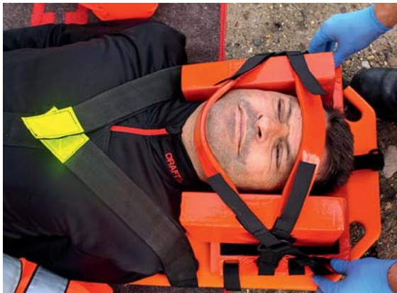
► Abb. 16 Die Head Blocks werden von beiden Seiten an den Kopf des Patienten herangeführt und am Spineboard fixiert. Komplette Immobilisierung mittels Stirn- und Kinngurt; die MILS kann jetzt aufgehoben werden (Darstellung hier ohne angelegte Zervikalstütze).

tient wird nun mit den Unterarmen an das Spineboard gepresst; danach vorsichtiges Zurückkippen von Patient und Board in Rückenlage.