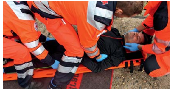
► Abb. 14 Korrektur der Patientenlage auf dem Spineboard: hierbei Fassen des Patienten unterhalb der Achseln am Thorax (Helfer 1) und am Becken (Helfer 2). Unter Beibehaltung der In-Line-Stabilisierung (Kopfhelfer) wird der Patient mittels longitudinalem Zug durch Helfer 1 unter Mitführung des Beckens durch Helfer 2 auf dem Spineboard gelagert.