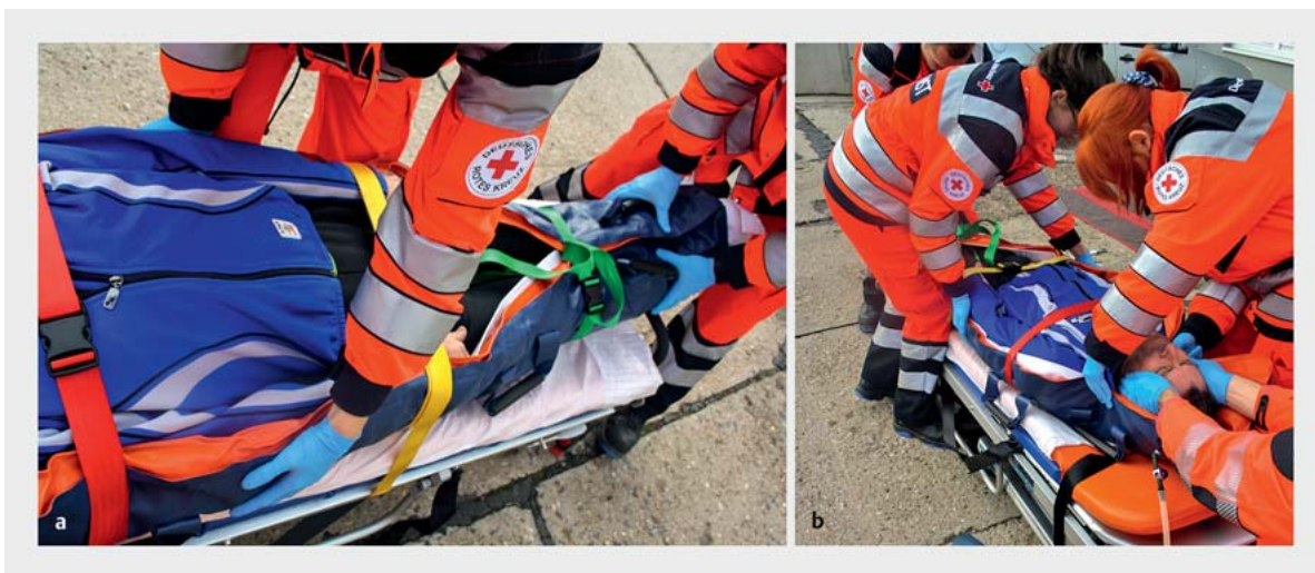
► Abb. 10 Anmodellieren der Vakuummatratze durch mehrere Helfer unter kontinuierlichem Absaugen der Luft. Anschließende Sicherung des Patienten mittels Gurtsystem. a Anmodellieren und Fixieren des unteren Teils der Vakuummatratze während des Absaugvorgangs. b Anmodellieren des Kopfteils der Vakuummatratze während des Absaugvorgangs unter kontinuierlicher MILS bis zur sicheren Fixierung.

Das Spineboard wird an die Patientenrückseite gebracht und fixiert, wobei der Patient weiter kontinuierlich an Schulter und Becken stabilisiert wird (► Abb. 13 ). Der Pa-