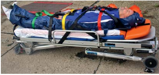
► Abb. 11 Komplett immobilisierter Patient in Vakuummatratze (Darstellung hier ohne angelegte Zervikalstütze) nach Anbringen aller Gurte (Vakuummatratze und Fahrtrage).