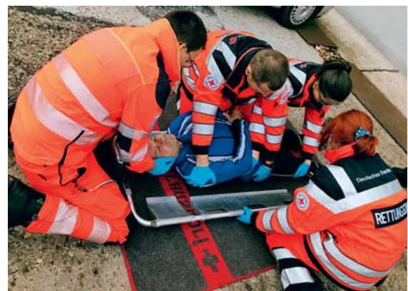
► Abb. 7 „Aufschauflern“ des Patienten durch geringe, achsengerechte Drehung unter kontinuierlicher MILS. Die beiden seitlich positionierten Helfer fassen den Patienten an Schulter, Becken und Oberschenkel unter Kreuzung ihrer Arme auf Beckenhöhe. Einbringen der Schaufeln von beiden Seiten und nachfolgendes Schließen der Verriegelung.

Das Anmodellieren der Vakuummatratze erfolgt durch mehrere Helfer unter kontinuierlichem Absaugen der