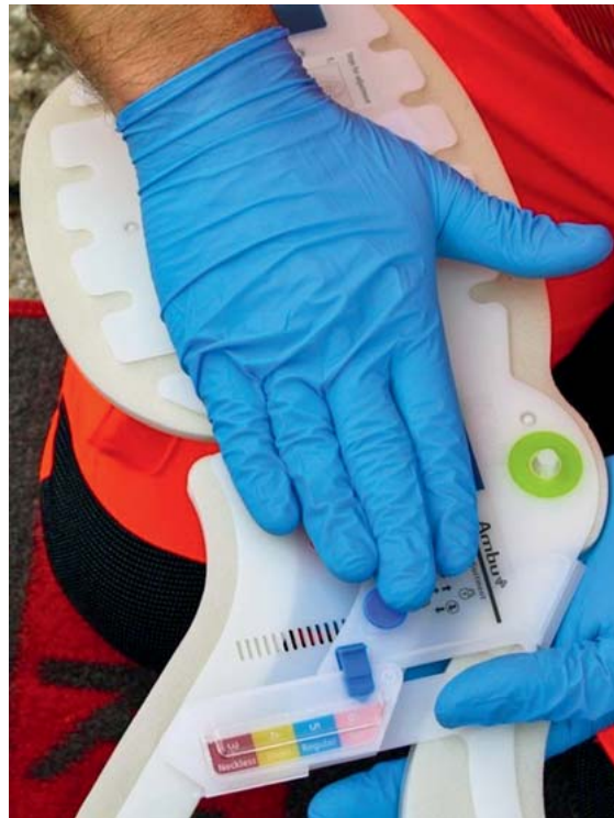
► Abb. 4 Größeneinstellung der Zervikalstütze anhand der ausgemessenen Halslänge; ggf. weitere Vorbereitung nach Herstellerangaben (z. B. Verriegelung).