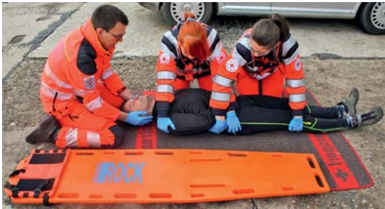
► Abb. 12 Vorbereitung des Patienten zum Log-Roll-Maßnahme: Die beiden seitlich positionierten Helfer fassen den Patienten an Schulter, Becken und Oberschenkel unter Kreuzung ihrer Arme auf Beckenhöhe. Der Kopfhelfer führt die MILS der HWS durch. Das Spineboard ist parallel zum Patienten (Unterkante auf Höhe der Kniekehlen des Patienten) ausgerichtet.