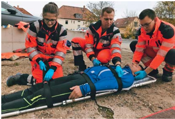
► Abb. 8 Sichere Fixierung des Patienten auf der Schaufeltrage mittels Gurtsystem.