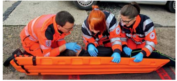
► Abb. 13 Achsengerechtes Drehen des Patienten unter kontinuierlicher MILS: Heranbringen des Spineboards an die Patientenrückseite unter Fortführung der Stabilisierung an Schulter und Becken. Sodann Anpressen des Patienten mit den Unterarmen an das Spineboard und Zurückkippen in Rückenlage.