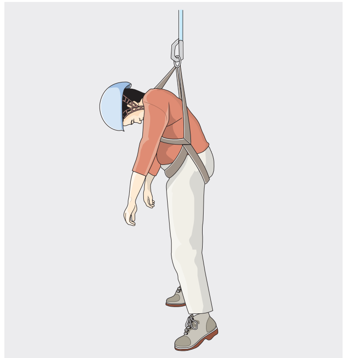
► Abb. 3 Gurtsysteme mit Anseilpunkt am Rücken führen zu einer sehr vertikalen Hänge- und Körperposition und damit zu einer erschwerten Selbststretzung zu einer möglichen Kompression der Femoralgefäße durch das eigene Körpergewicht und – bei Bewusstlosigkeit – zu einer Flexion des Kopfes mit erhöhtem Risiko der Atemwegsverlegung.

Generell müssen Gurtsysteme optimal an die Körperproportionen angepasst werden, sodass ein schmerzfreies Hängen möglich ist. Während des passiven freien Hängens soll sich der Körper idealerweise in eine halb horizontale Position einstellen, sodass das venöse Pooling reduziert wird [2, 6, 22]. Bei richtig angepassten Gurten kann eine Gefäßkompression, vor allem der Femoralgefäße, wirkungsvoll vermieden werden [3].