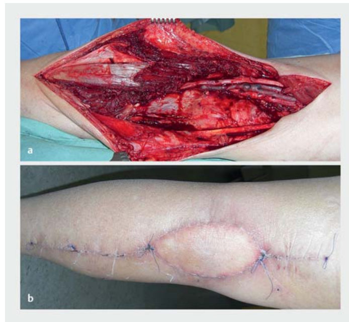
► Abb. 5 a Defekt in der Kniekehle nach Sarkomresektion. b Deckung in der Kniekehle mit freiem lateralem Oberarmlappen.

Der M. sartorius wird – im Unterschied zu den bisher beschriebenen Muskeln – nicht von einem dominanten Gefäß, sondern von mehreren segmentalen Gefäßen im gesamten Verlauf versorgt. Möglich ist hier eine Durchtrennung der proximalen Gefäße in einem ersten Schritt. Nach einem Intervall ist die neue Blutversorgung etab-