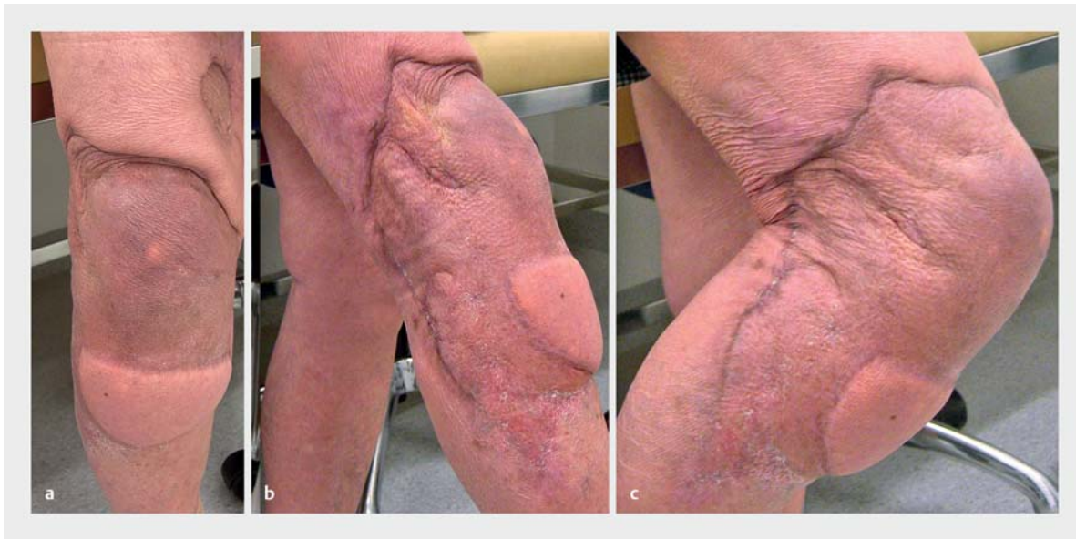
► Abb. 4 Latissimuslappen im Kniebereich in Streckung und Beugung. Defekt durch Pyoderma gangraenosum nach Kniearthroskopie.

Kniekehle der Muskel auch vom Ansatz am Oberschenkel unter Erhalt des Gefäßstieles abgesetzt werden. Die sehnigen Anteile werden entfernt oder eingekerbt, um die Reichweite des Muskels zu erhöhen. Anschließend kann der Muskel in den Defekt eingelegt werden (► Abb. 3 a–d ).