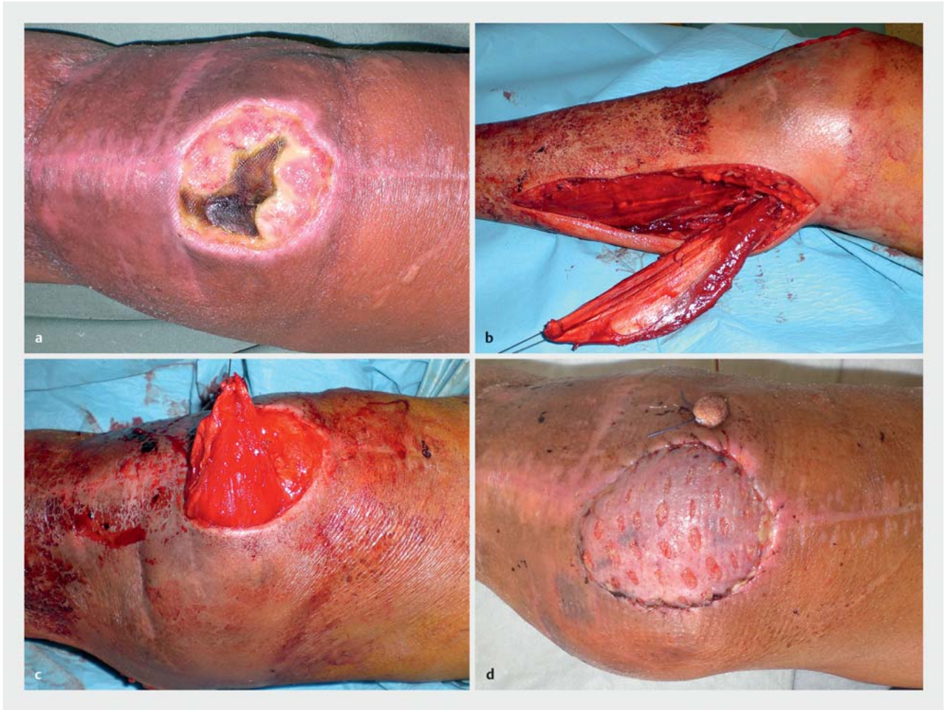
► Abb. 1 a Defekt nach Débridement einer Bursitis praepatellaris. b–d Rekonstruktion mit gestieltem medialen Gastroknemiuslappen und Spalthaut.

erfolgen und nicht nur mit einem scharfen Löffel kürettiert werden. Oberflächlich nekrotische oder angetrocknete Sehnen-, Kapsel- und Bandstrukturen sollten hierbei dünn angefrischt werden, wenn möglich unter Erhalt der Funktion.