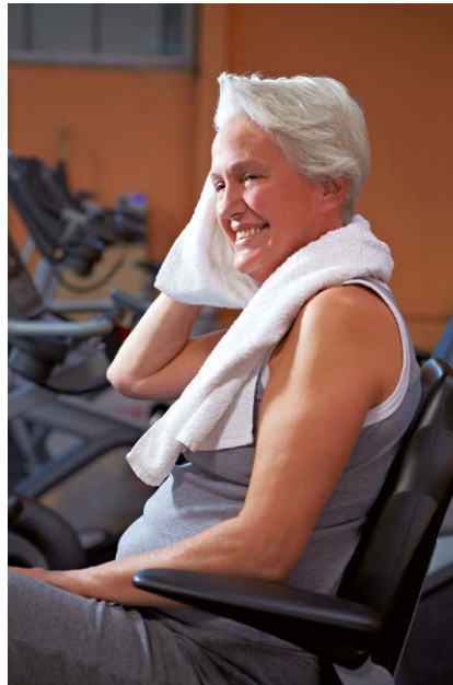
►Abb. 1 Geprüfte Empfehlung: Sport schützt vor Brustkrebs, KHK und reduziert auch das Rezidivrisiko (Symbolbild).

Jetzt kann man die Empfehlung, sich regelmäßig zu bewegen und ein individuell abgestimmtes Herz-Kreislauf-Training zu beginnen, auch um den kardioprotektiven Effekt erweitern. Übrigens, 9 MET-Stunden pro Woche entsprechen 3–5 Einheiten mit mittlerer bis hoher Trainingsintensität von mindestens 20-minütiger Dauer (►Abb. 1).