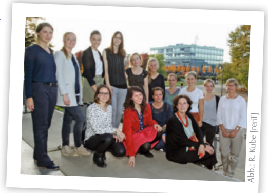
Abb.: R. Kube [erif]

Neben einer abgeschlossenen Berufsausbildung sollten Bewerber eine Hochschulzugangsberechtigung mitbringen. Das Studium ist gebührenfrei und beginnt zu jedem Wintersemester, der nächste Studienstart ist der 14. Oktober 2019. Interessierte können sich vom 1. Mai bis zum 15. September einschreiben. Der diesjährige Schnuppertag findet am 24. Mai 2019 statt. Mehr Informationen zum Studiengang finden Sie unter www.ergo.uni-luebeck.de . mru