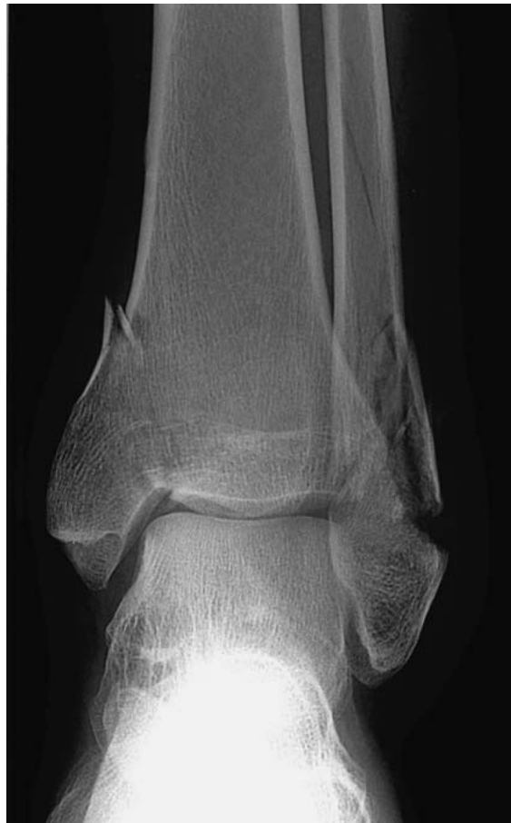
► Abb. 1 Bimalleoläre Sprunggelenksfraktur. (aus: [6])

In der Osteopathie spielen die Flüssigkeiten eine zentrale Rolle. Wir bestehen aus Flüssigkeit in Flüssigkeit und W. G. Sutherland beschreibt es mit der Aussage: „Was ist