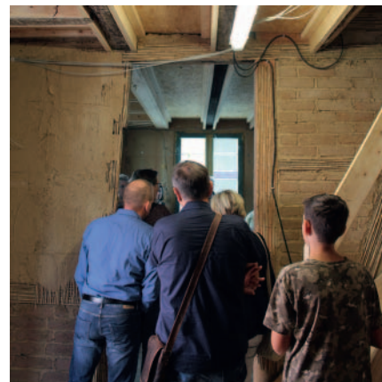
Hereinspaziert: Viele Neugierige machten sich ein Bild von den Baufortschritten im Röntgen-Geburtsaus.