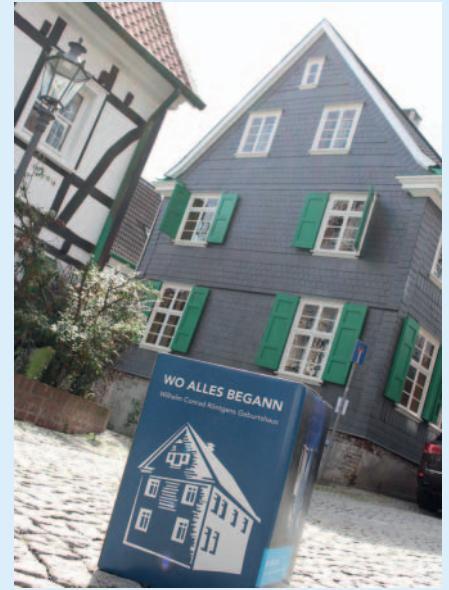
Bei schönsten Sonnenwetter präsentierte sich das Geburtshaus zum Tag des offenen Denkmals 2018 mit neuen Fenstern und renovierter Schieferfassade.

der Region, Deutschland und der Welt genutzt und erlebt werden kann.