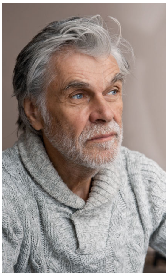
► Abb. 1 Häufig treten nach Schlaganfall psychische Begleiterkrankungen auf. (nachgestellte Situation)

Definitionen Vereinfacht gesagt beschreibt PSCI jeglichen kognitiven Verfall seit dem Eintreten eines Schlaganfalls [19]. PSCI ist eine Hauptuntergruppe vaskulär-kognitiver Einschränkungen (vascular cognitive impairment, VCI, ► Abb. 2 ). Sie ist jedoch nicht deckungsgleich mit