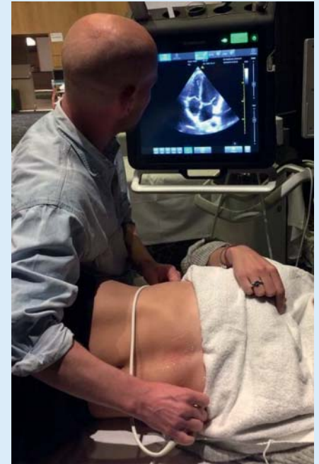
Et stemningsbilde fra en hands-on-sesjon for ultralyd i legevakt og akuttmottak.

Sesjonen hadde flere spennende foredrag med internasjonalt anerkjente forelesere.