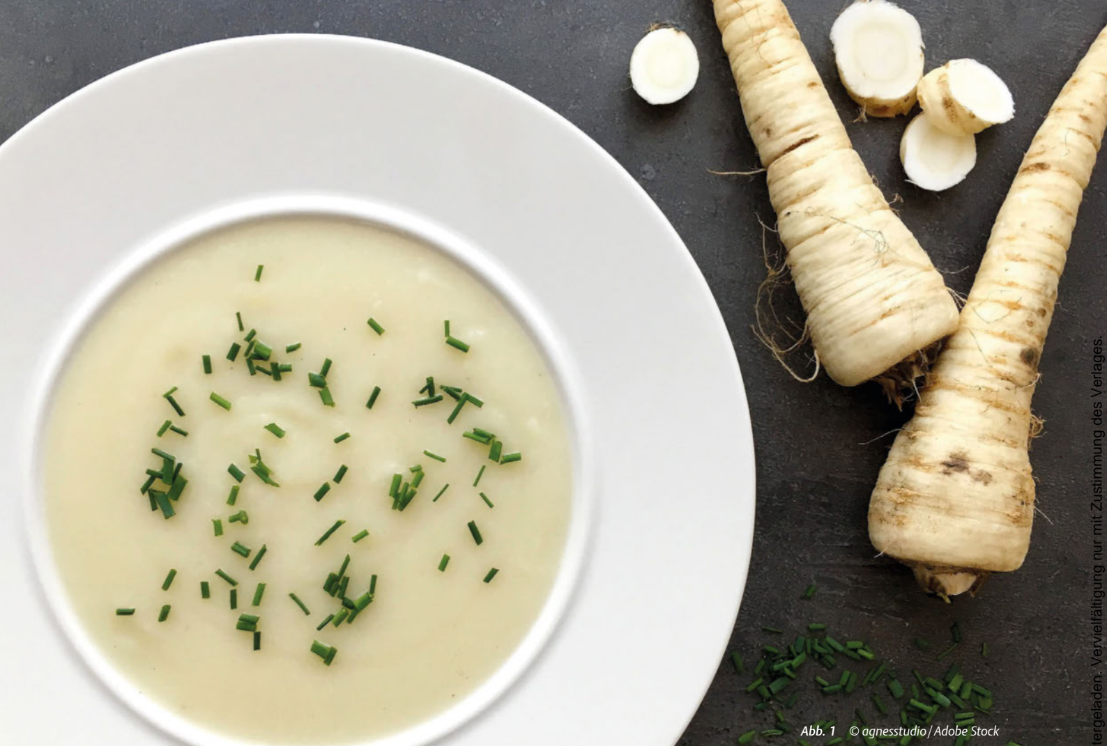
Abb. 1