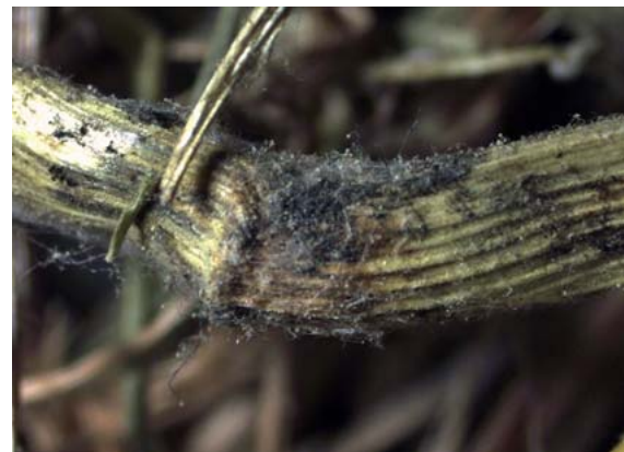
► Abb. 2 Mikrobiell kontaminiertes Heu (10-fache Lupenvergrößerung).

Bei schlechten Heu- oder Strohqualitäten fällt beim Aufschütteln eine deutlich erkennbare Staubentwicklung auf, die als Indiz für einen erhöhten Besatz mit Schmutzpartikeln sowie Bakterien und Schimmelpilzen gewertet werden kann. Des Weiteren weisen solche Heu- und Strohqualitäten z. T. eine gräuliche Farbe auf und die Fut-