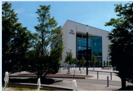
Das Kap Europa Frankfurt, Austragungsort der 53. Jahrestagung der DGNR 2018

Der Kölner Stadtteil Gürzenich war ein wichtiger Ort für den NeuroRad – um anzukommen, zu wachsen und zu der „Marke“ zu werden, die der Kongress heute ist. Mit den Jahren aber ist die Location zu klein geworden und hat sich als nicht mehr zeitgemäß für eine moderne Kongressgestaltung erwiesen. Das Kap Europa, das ab