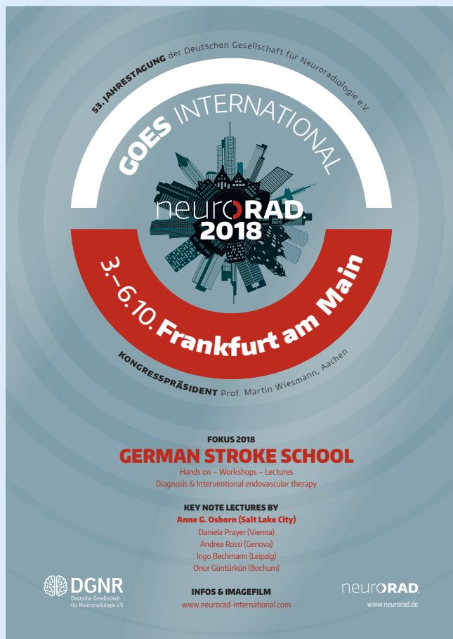
Plakat der 53. Jahrestagung 2018

Die deutschen Neuroradiologen sind hochgefragte Referenten im Ausland; man schaut besonders auf die interventionelle Neuroradiologie, die endovaskuläre Schlaganfalltherapie, die maßgeblich in Deutschland entwickelt wurde und zur flächendeckenden Versorgung geführt hat. Da lag die Idee in der Luft, ausländische Kollegen – gerade aus den angrenzenden Ländern – zu unserem Kongress nach Deutschland einzuladen. Die „German-Stroke-School“ im Speziellen lädt Kolleginnen und Kollegen zu intensiven, simulatoren-unterstützten Hands-On-Workshops ein. Darüber hinaus bieten wir ein hochattraktives englischsprachiges Vortragsprogramm mit interessanten Referenten, das sicher auch DGNR-Kolleginnen und -Kollegen ansprechen wird.