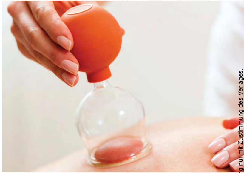
Abb. 1 Schöpftherapie: Die Abrechnung erfolgt über die GebüH-Ziffern 27.3, 27.4 und 27.5.

Besprechen Sie vor der geplanten Behandlung mit dem Patienten die ungefähren Kosten. Weisen Sie Privatversicherte hierbei darauf hin, dass eine Kostenübernahme der privaten Krankenversicherung oder der Beihilfe (sofern diese beteiligt ist)