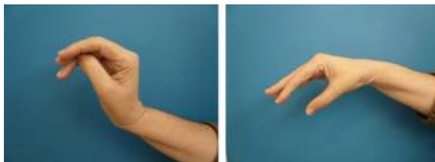
Figura 4 Resultado clínico.

No se procedió a la reconstrucción nerviosa inmediata hasta la confirmación histológica del tumor (NF solitario benigno). El postoperatorio cursó con una parálisis iatrogénica de la extensión del codo, muñeca y dedos (en 15 días recuperó la extensión del codo). Para la reconstrucción