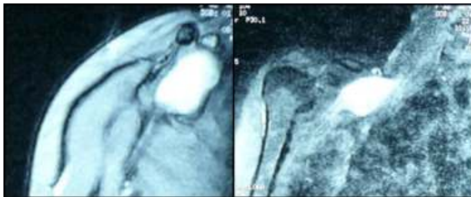
Figura 1 RNM de la tumoración.

Se presenta un caso de NF solitario en C7 confundido y tratado durante un año como una tendinopatía de «De Quervain», en el que se realizó una resección completa 2,3 y se restauró la función motora mediante transferencias nerviosas en el antebrazo 4 .