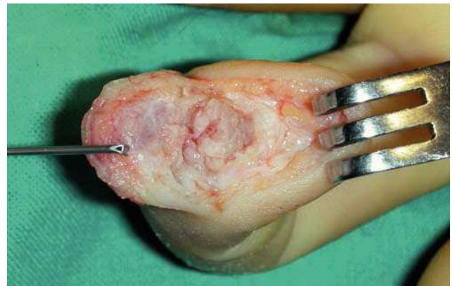
Figura 1 Acceso realizado en el caso 1. Nótese que la parte transversal de la incisión se sitúa justo en el límite del lecho ungueal.

Se obtuvo la consolidación radiológica a los 2 meses de seguimiento, estando el paciente asintomático en la última revisión, al año, y con una movilidad de la interfalángica distal (IFD) de 0°/55°.