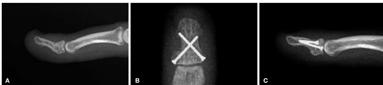
Figura 4 (A) Angulación dorsal de una mala unión de la falange distal correspondiente al caso 4. (B) Se observa la colocación de los dos tornillos de minifragmentos de 1 mm de diámetro entrados desde la parte lateral de la base de la falange. Los tornillos tienen un buen agarre en la cortical opuesta. (C) Proyección lateral del mismo caso.

Barton 7 que, en su revisión, encontró tasas de no unión para los metacarpianos del 0,7% y para las falanges del 0,2%, aunque incluía a todas las falanges en la revisión. Van Oosterom 8 reportó un 6% de pseudoartrosis en fracturas de falanges tratadas quirúrgicamente. A pesar de una aparente baja prevalencia en algunas de las series, la no consolidación genera una considerable incapacidad para realizar labores de la vida diaria en el 70% de los pacientes 5 .