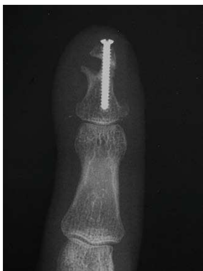
Figura 3 Aspecto de la consolidación parcial del caso 3.

Por vía dorsal se realizó una osteotomía correctora entre la inserción del tendón extensor y el inicio de la matriz ungueal que se fijó con dos tornillos de 1 mm compact hand (DePuy-Synthes, West Chester, PA, EE.UU.) que consolidó sin incidencias a las 8 semanas (fig. 4B y 4C) y presentando una movilidad de 0^\circ/75^\circ en la IFD a los 5 meses.