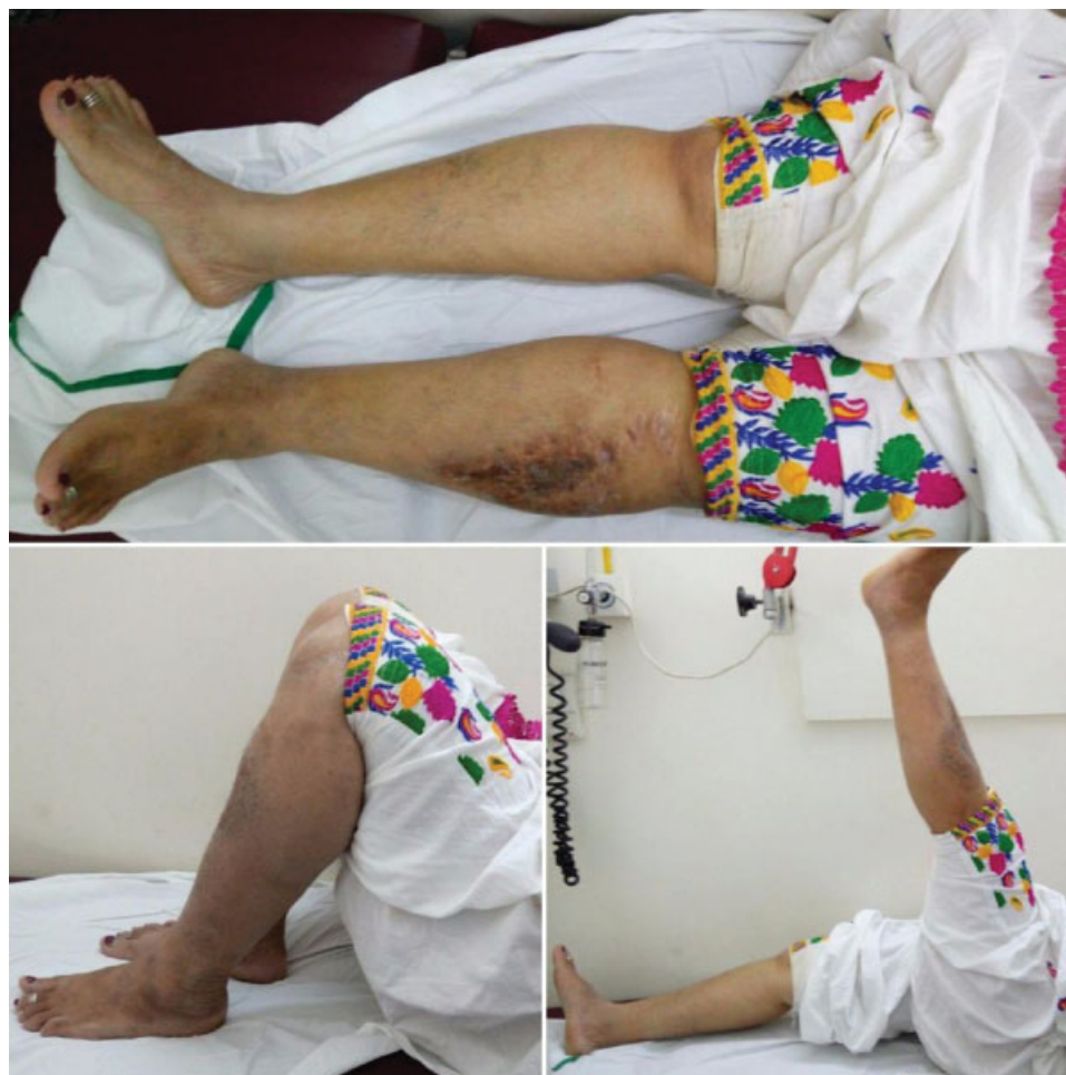
Fig. 3 Avaliação funcional do paciente da ►Fig. 2 em 7 anos.