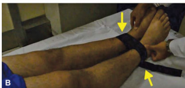
Fig. 1 O paciente é colocado em decúbito dorsal na mesa radiográfica e estende os joelhos. Os tornozelos e as coxas dos dois membros devem ficar em contato. A seguir, uma fita de Velcro (seta amarela) é usada à altura supramaleolar para manter o contato entre os maléolos mediais.