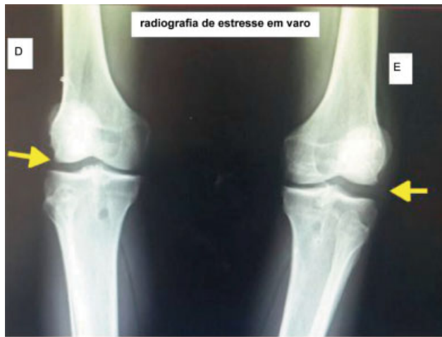
Fig. 4 A radiografia bilateral final de estresse em varo simultâneo é mostrada nesta figura. O triângulo de espuma colocado entre os joelhos e a fita de Velcro à altura supramaleolar produzem um estresse em varo nos dois joelhos ao mesmo tempo; assim, apenas uma radiografia é necessária para a avaliação da diferença lado a lado do compartimento lateral. As setas amarelas mostram o espaço lateral. Abreviaturas: D, direita; E, esquerda.

último caso, a espuma é removida da fossa poplíteia. Depois da realização de todas as etapas anteriores, o médico deve assegurar que as duas patelas estão à mesma altura. A seguir, o tubo radiográfico é colocado a 1 metro do cassete radiográfico, centralizado nas duas patelas, e a imagem é adquirida. As vantagens e desvantagens de nossa técnica são apresentadas na Tabela 1 , enquanto a Tabela 2 mostra seus prós e contras.