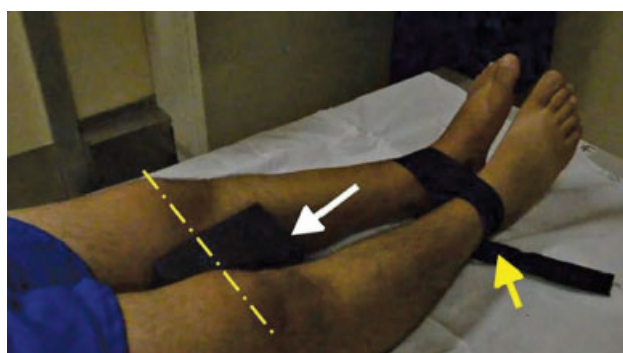
Fig. 3 Depois da colocação correta da fita de Velcro (seta amarela) e do triângulo de espuma (seta branca), o vetor de força aplicado no joelho simula o estresse em varo manual das radiografias. É importante notar que é essencial que as duas patelas sejam perpendiculares à mesa radiográfica e que a altura patelar seja regular (linha amarela).

entre as coxas, os membros tendem a abduzir; no entanto, a fita de Velcro colocada em volta dos tornozelos evita o deslocamento dos membros. O vetor resultante é um estresse em varo realizado de maneira simultânea nos dois joelhos (► Fig. 3). Este exame é capaz de detectar a lassidão lateral simultânea e bilateral em uma única radiografia (► Fig. 4). Esta técnica pode ser realizada com o joelho em flexão ou extensão; neste