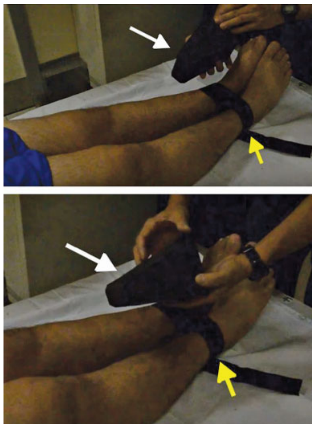
Fig. 2 Após a colocação da fita de Velcro (setas amarelas) em volta dos tornozelos à altura supramaleolar, a atenção é dedicada à aplicação do estresse em varo no joelho. O triângulo de espuma (setas brancas), feito com etileno acetato de vinila, é colocado entre os joelhos. É importante assegurar o posicionamento da base do triângulo à altura da tuberosidade tibial e da ponta do triângulo à altura do fêmur distal.

Após a colocação da fita de Velcro em volta dos tornozelos, à altura supramaleolar, o triângulo de espuma (► Fig. 2) é usado para aplicação do estresse em varo no joelho. Assegurando o posicionamento correto dos membros, o triângulo de espuma (feito de etileno acetato de vinila) é gentilmente colocado entre os joelhos que estavam bem próximos. O aspecto menor da espuma (ponta) fica em direção proximal, enquanto a base do triângulo continua à altura da tuberosidade tibial. O médico deve assegurar que os maléolos mediais estejam em contato, e que a fita de Velcro não mude a posição. Ao inserir a espuma