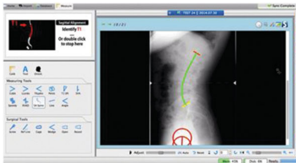
Fig. 3 Exemplo das medições com uso do software Surgimap: raio-X lombossacral ortostático perfil incluindo cabeças femorais.

Os resultados de variáveis quantitativas foram descritos por médias, medianas, valores mínimos, valores máximos e desvios padrões (DPs). Variáveis qualitativas foram descritas por frequências e percentuais. A comparação entre duas avaliações foi feita considerando-se o teste t de Student para amostras pareadas. A condição de normalidade das variáveis foi avaliada pelo teste de Kolmogorov-Smirnov. Valores de p < 0,05 indicaram significância estatística. Os dados foram analisados com o programa computacional IBM SPSS Statistics for Windows, Versão 20.0 (IBM Corp., Armonk, NY, EUA).