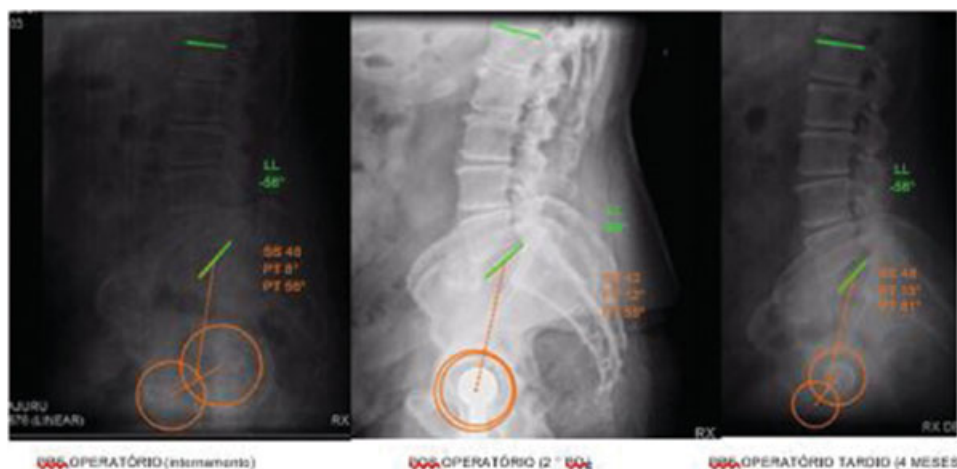
Fig. 2 Exemplo das medições: raio-X lombossacral ortostático perfil pré-operatório, pósoperatório imediato e pós-operatório.

Para avaliação do ES, usamos as medições da LL, do SS, do PT e da PI. Essas medidas foram avaliadas por um mesmo residente de cirurgia da coluna por meio do aplicativo Surgimap Spine (Surgimap, Nova York, NY, EUA) (► Fig. 3), software gratuito que faz medições radiográficas com maior precisão quando comparada à radiografia impressa e integrada a medição com ferramentas para aferições da coluna e planejamento cirúrgico. 4,5