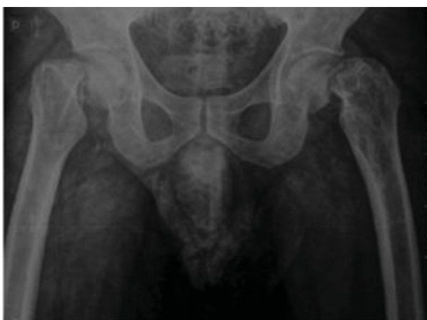
Fig. 1 Radiografia anteroposterior da bacia pré-operatória.

Paciente de 36 anos, masculino, branco, e trabalhava como motoboy. História prévia de traumatismo crânio encefálico havia 4 anos, submetido a procedimentos neurocirúrgicos. Referia episódios convulsivos desde então, em uso contínuo de fenitoína e acompanhamento neurológico regular, porém persistia com episódios convulsivos.