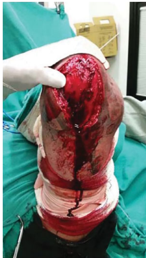
Fig. 1 Acesso posterior cirúrgico.

O paciente foi avaliado através do dinamômetro isocinético (CybexII+, Nova York, NY, Estados Unidos) no pré-operatório e 5 meses após a cirurgia. Foi avaliada a flexoestensão. O braço direito foi usado como o lado controle.