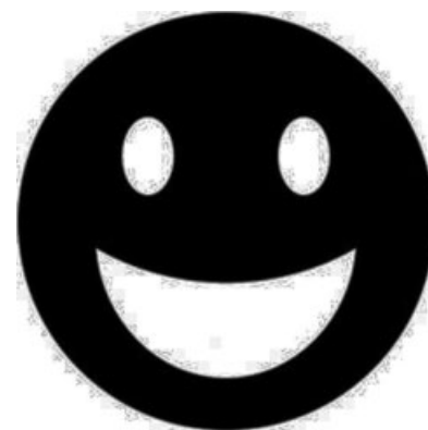
Fig. 2 Emoticon con cara feliz.